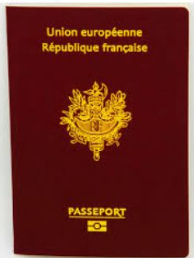
un Le passeport