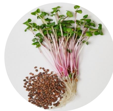
РЕДИС «ЧАЙНАЯ РОЗА»