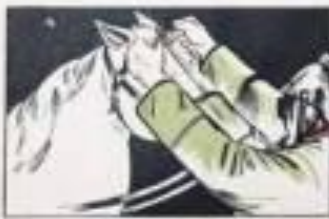
Прикрепить боковые тесьмы противогаза к седловому ремню узда.