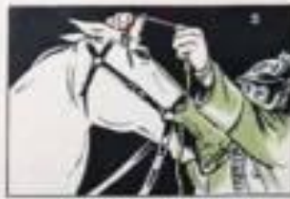
Взять затягивающие тесьмы за уши лошади.