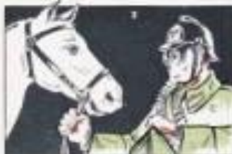
Возьмите противогаз и обеими руками вверните лямочки боковых ремешков.

ТРЕТИЙ туго затянув лямочки тесьмы, прикрепляет ее к седловому ремню узда (рис. 4). ЧЕТВЕРТЫЙ натянув затягивающие тесьмы, быстро отходят от нее за уши лошади (рис. 5). ПЯТЫЙ затягивает туго круговые тесьмы и закрепляет их; исправляют недостатки надевания (рис. 6). Надевание противогаза производится в следующей последовательности: 1) распускают круговые тесьмы и отклоняют голову, отпуская затягивающие тесьмы (на расстоянии 10) через уши лошади и вынимают противогаз из узда. 2) держат противогаз как развешенный наковальня высовывают на него тесьмы; 3) скрывают противогаз вдаль, зажимают и наводят его в кашку. Если нужно противогаз отвести в „походный“ положение, то мешок отсоединяют. Противогаз и мешочек прикрепят одним ремнем к татуировке мешка, с таким расчетом, чтобы мешочек не мешал их доставать.