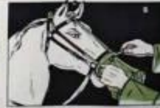
Затянуть и закрепить круговые тесьмы.