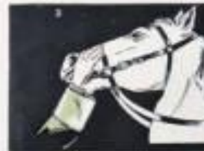
Вставить боковой лямочки правой руки в рот лошади и, взявшись им за твердое небо, отклонить голову животного с левой поддушкой в рот лошади.