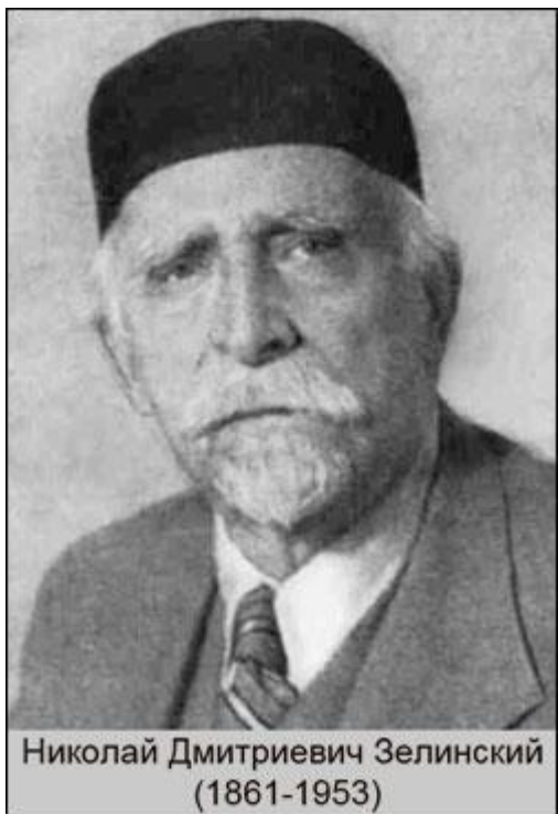
Николай Дмитриевич Зелинский (1861-1953)

И уже в конце лета 1915 года эту нелегкую задачу удалось решить русскому ученому Николаю Дмитриевичу Зелинскому.