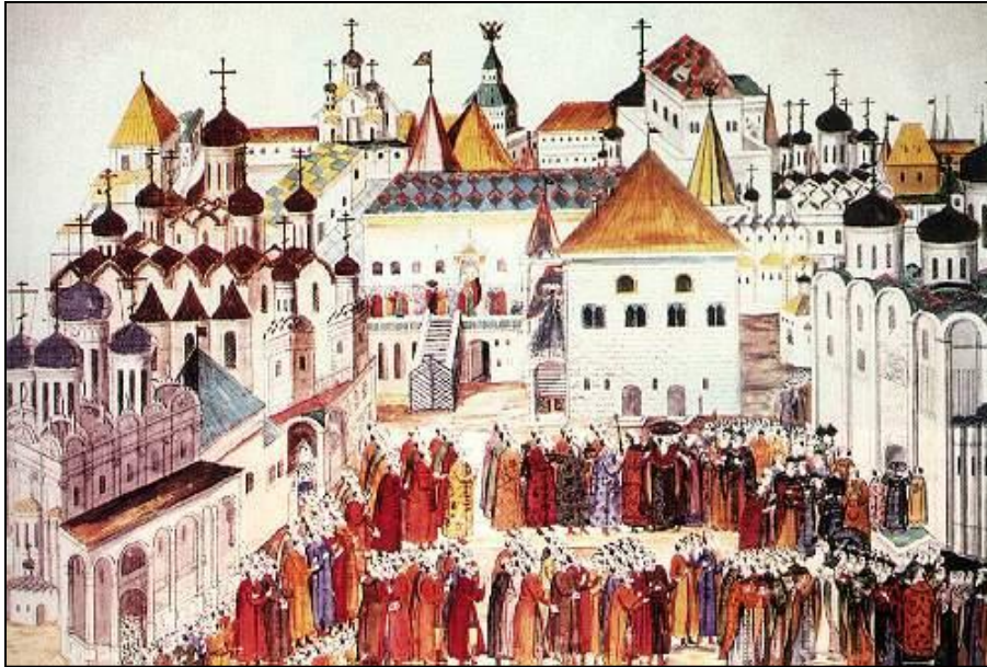
Встреча Лжедмитрия москвичами

18 июля он встретился с матерью Дмитрия царевича Марией Ногой, которая признала в нем своего сына.