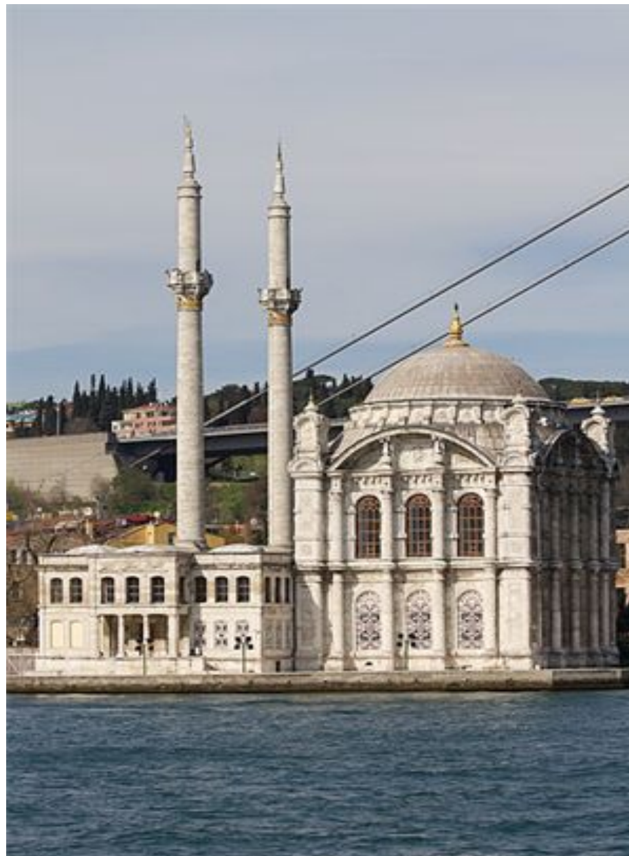
Мечеть Ортакёй в Стамбуле