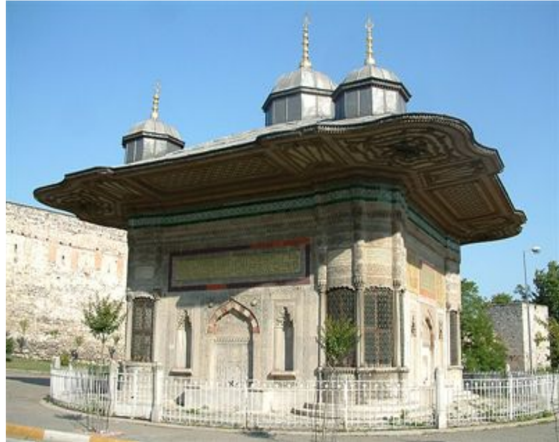
Фонтан Ахмеда III в Стамбуле