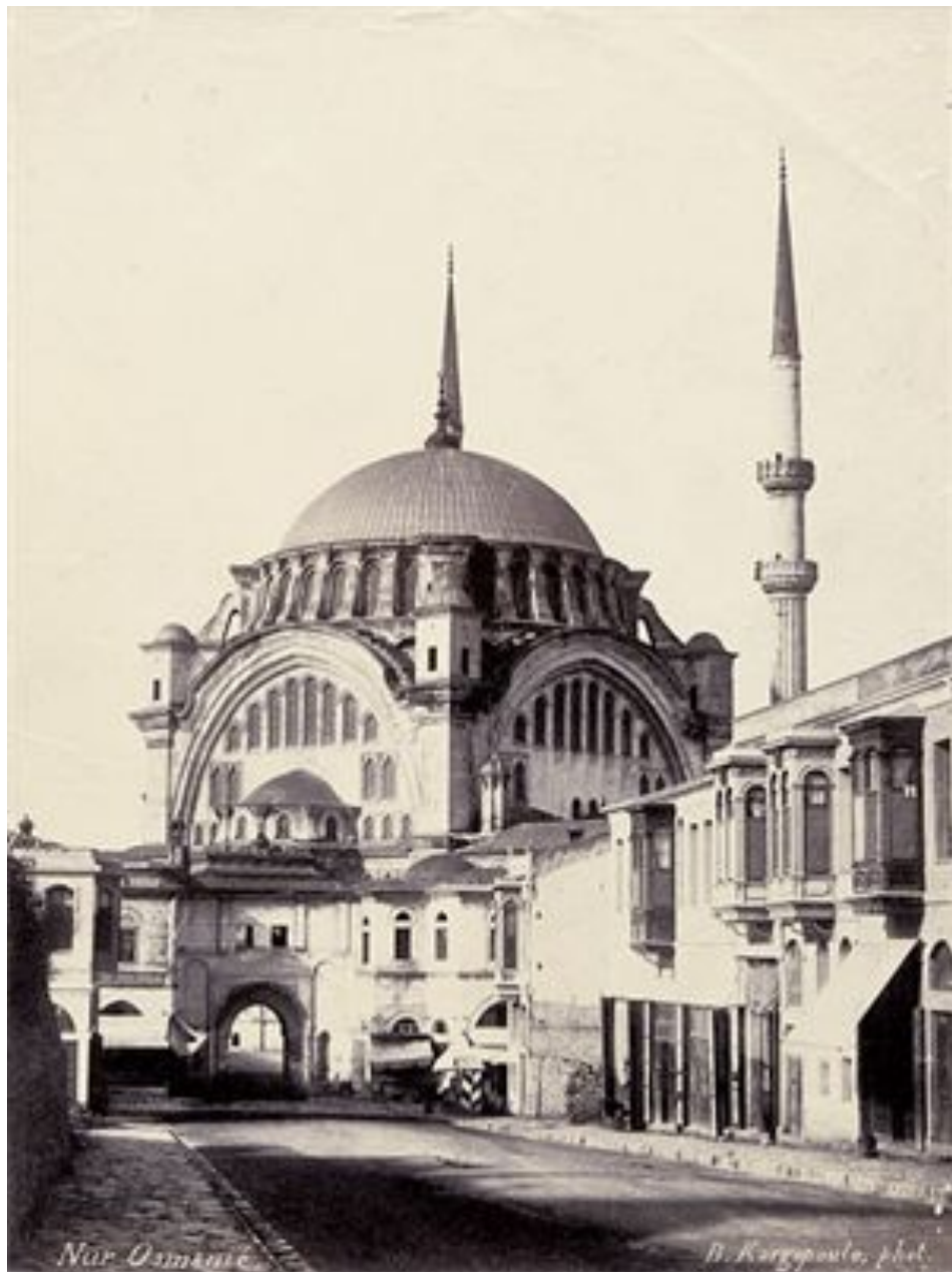
Мечеть Нуруосмание в Стамбуле