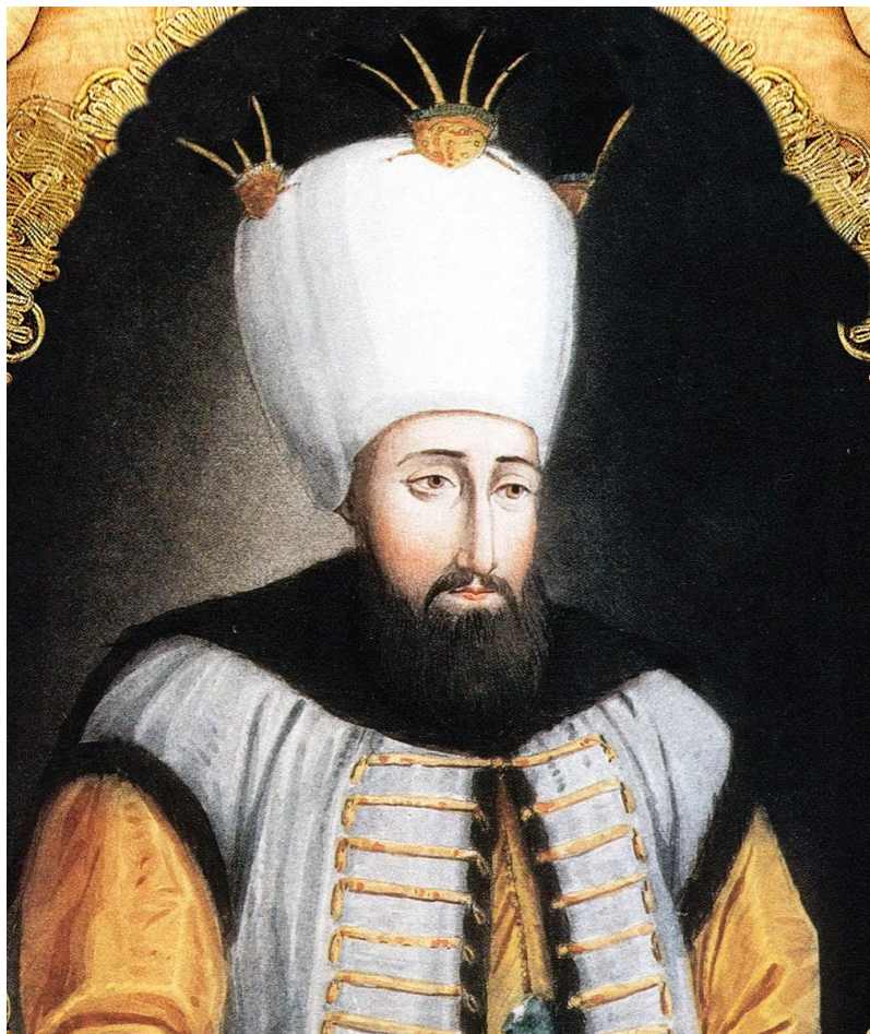
Ахмед III (1703–1730)