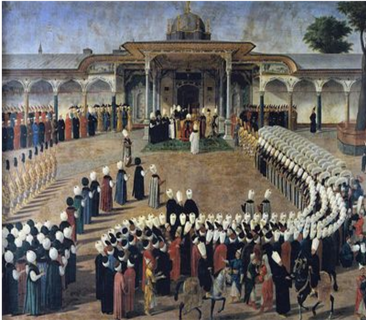
Селим III проводит аудиенцию