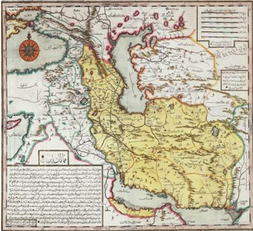
Печатная карта Персии