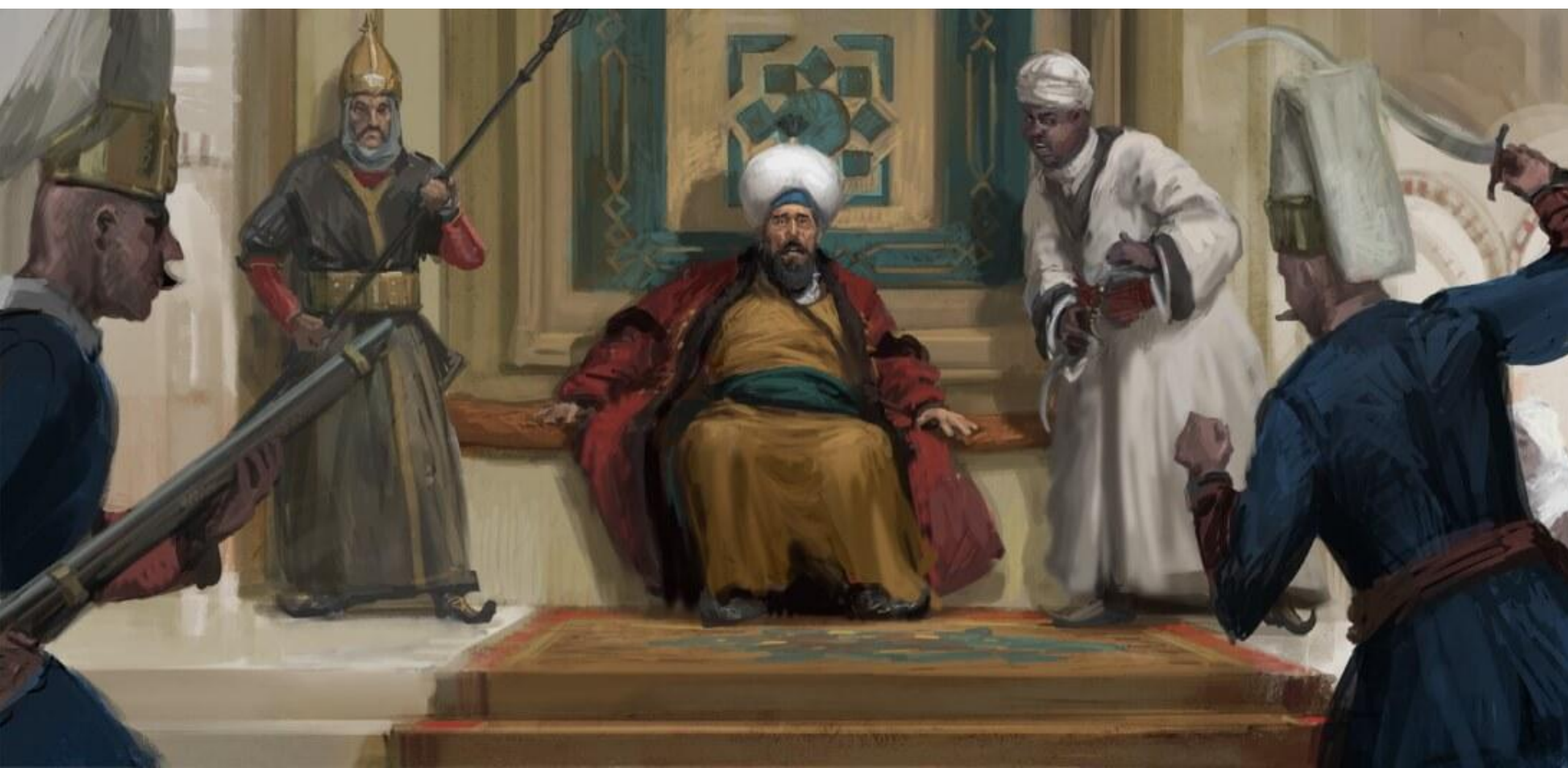
Поход Наполеона в Египет