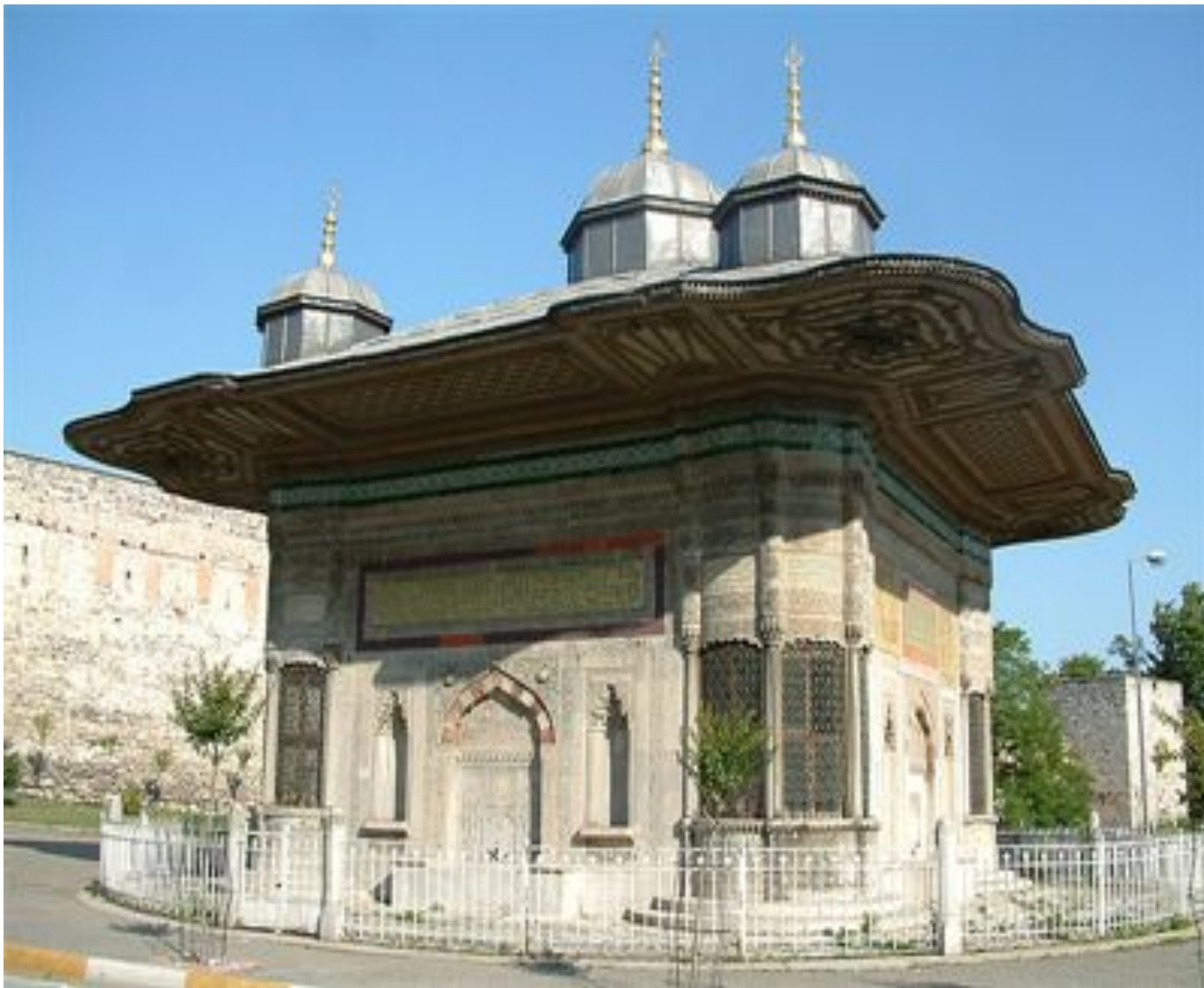
Фонтан Ахмеда III в Стамбуле