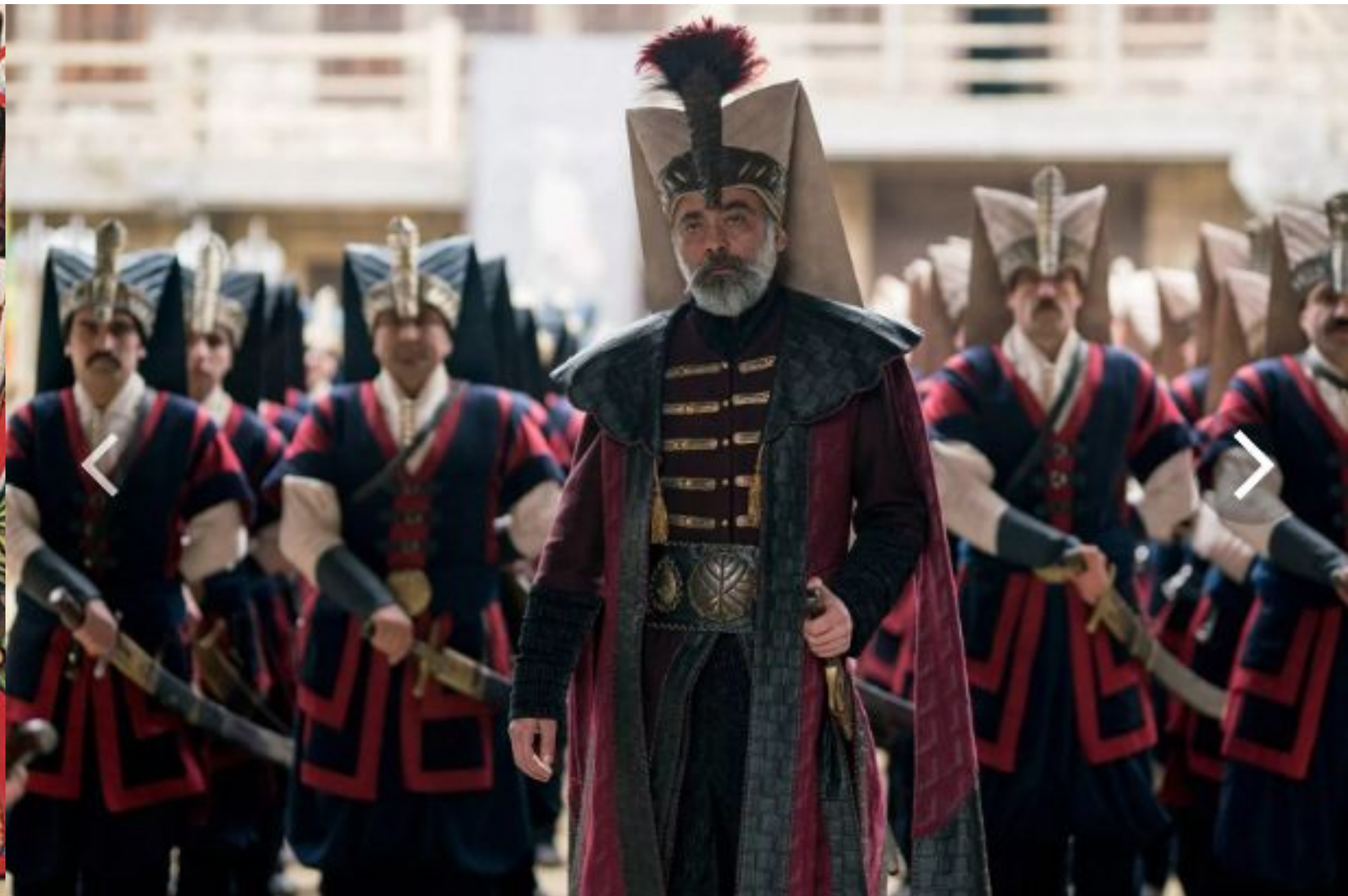
Султан в окружении янычар