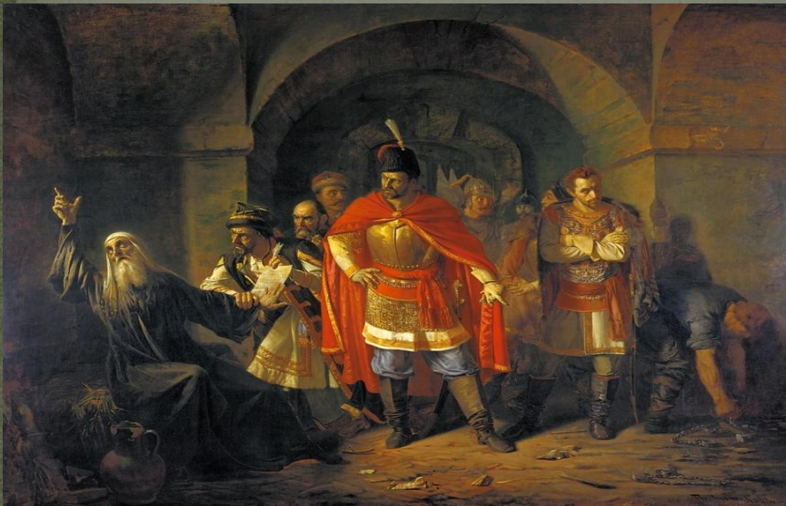
Чистяков П.П. «Патриарх Гермоген отказывает полякам подписать грамоту»

Рост авторитета церкви в Смутное время. Патриарх Иов не признал власти Лжедмитрия I. Патриарх Гермоген призвал к вооруженному сопротивлению против поляков