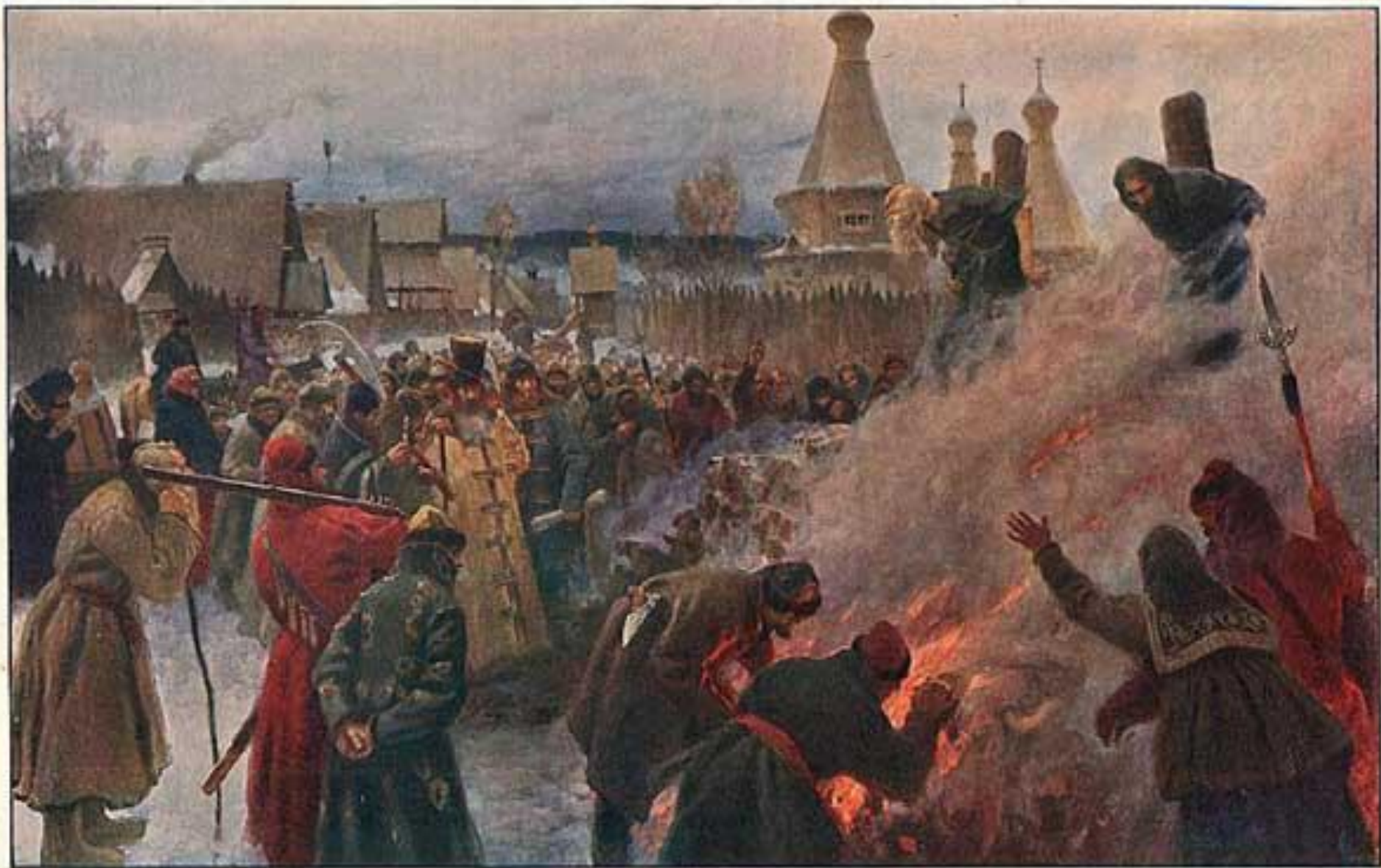
П. Мисофдовъ. Сожженію протопопа Аввакума. Музей Императорской Академіи Художествъ.