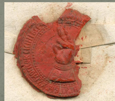
Печать патриарха Никона