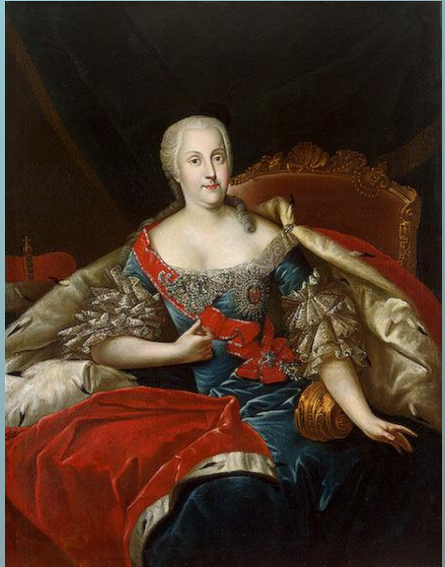
Христиан-Август Ангальт-Цербстский Иоганна-Елизавета Гольштейн-Готторпская