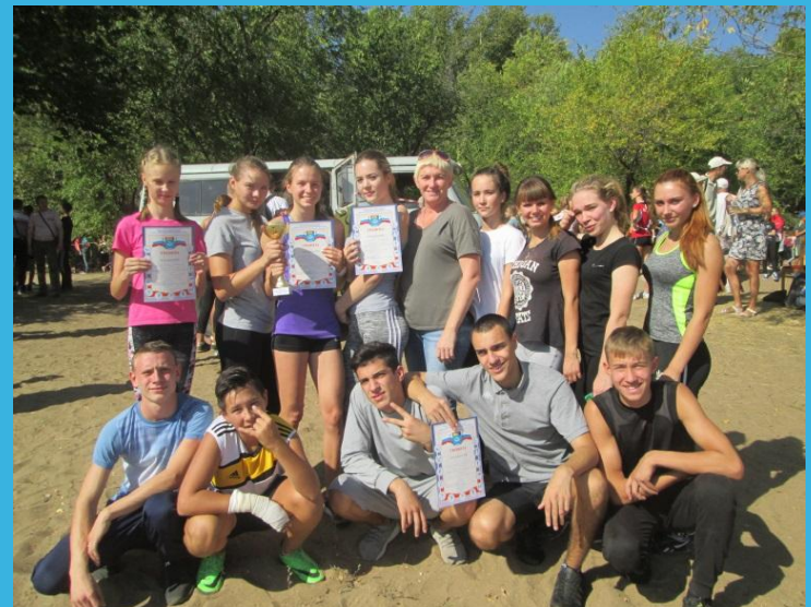
Весенний кросс 2 место (2018 год)