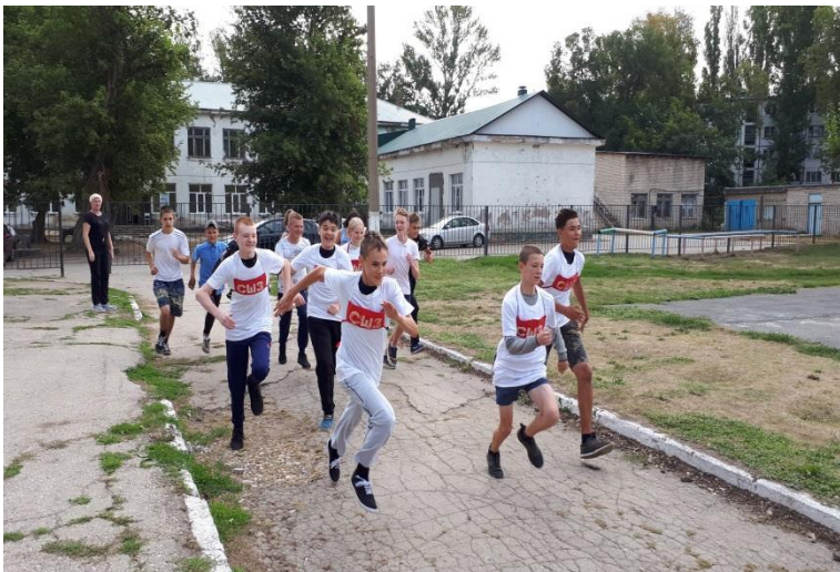
Подготовка к городскому кроссу (2018год)