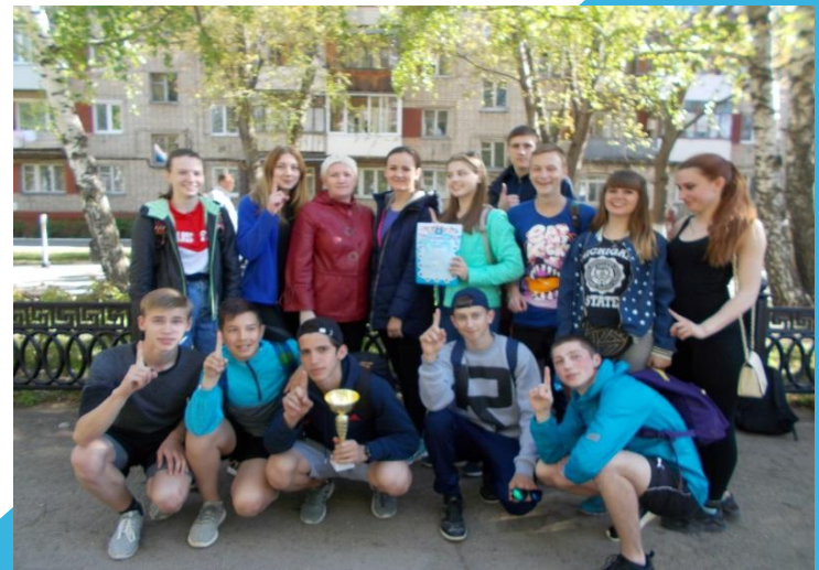
1 место в легкоатлетической эстафете, посвященной дню Великой Победы ( 2017год )