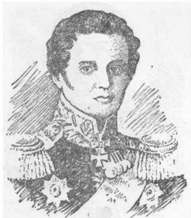
АЛЕКСАНДР ДМИТРИЕВИЧ ЗАСЯДЬКО И ЕГО РАКЕТНАЯ УСТАНОВКА