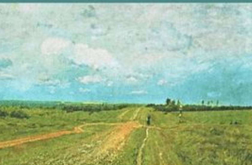
И. И. Левитан. Владимирка.