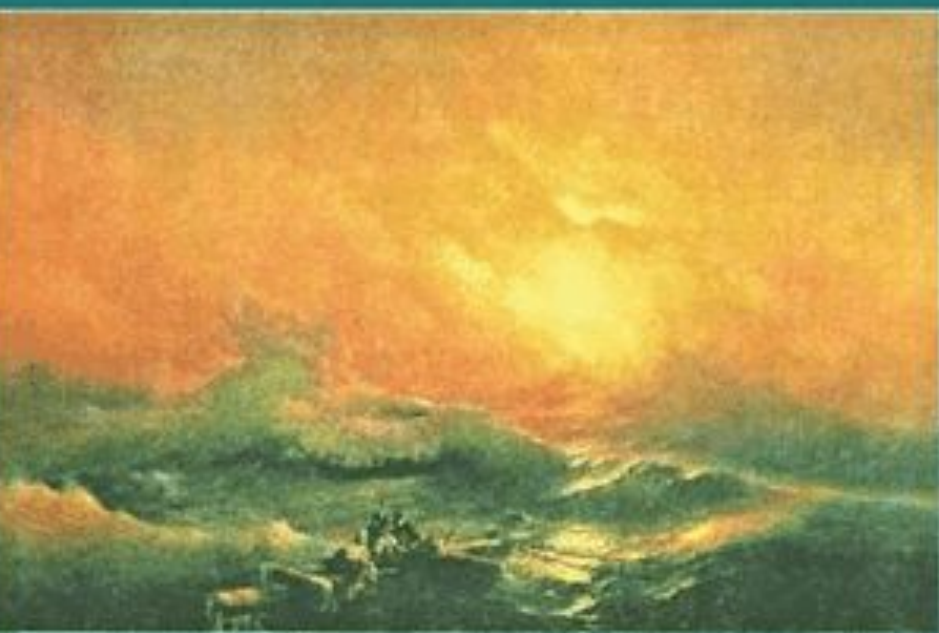
Н.Айвазовский. Девятый вал. Морской берег.