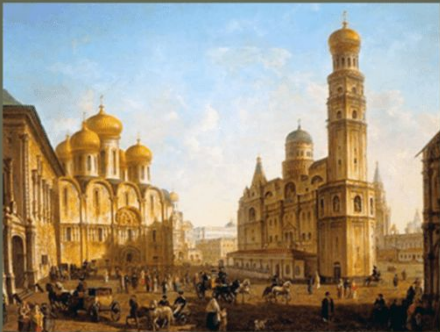
Федор Алексеев «Соборная площадь Московского кремля»