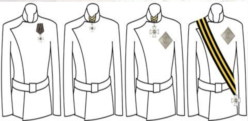
(слева направо с 4-й по 1-)

Полных кавалеров ордена св. Георгия, т.е. получивших знаки всех степеней, за всю историю России было четверо: