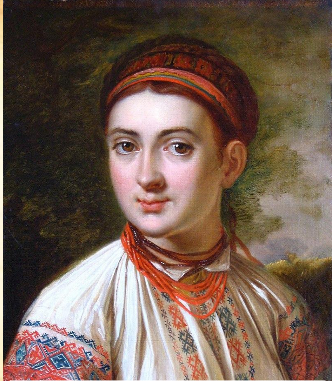
«Дівчина з Поділля» В. Тропінін