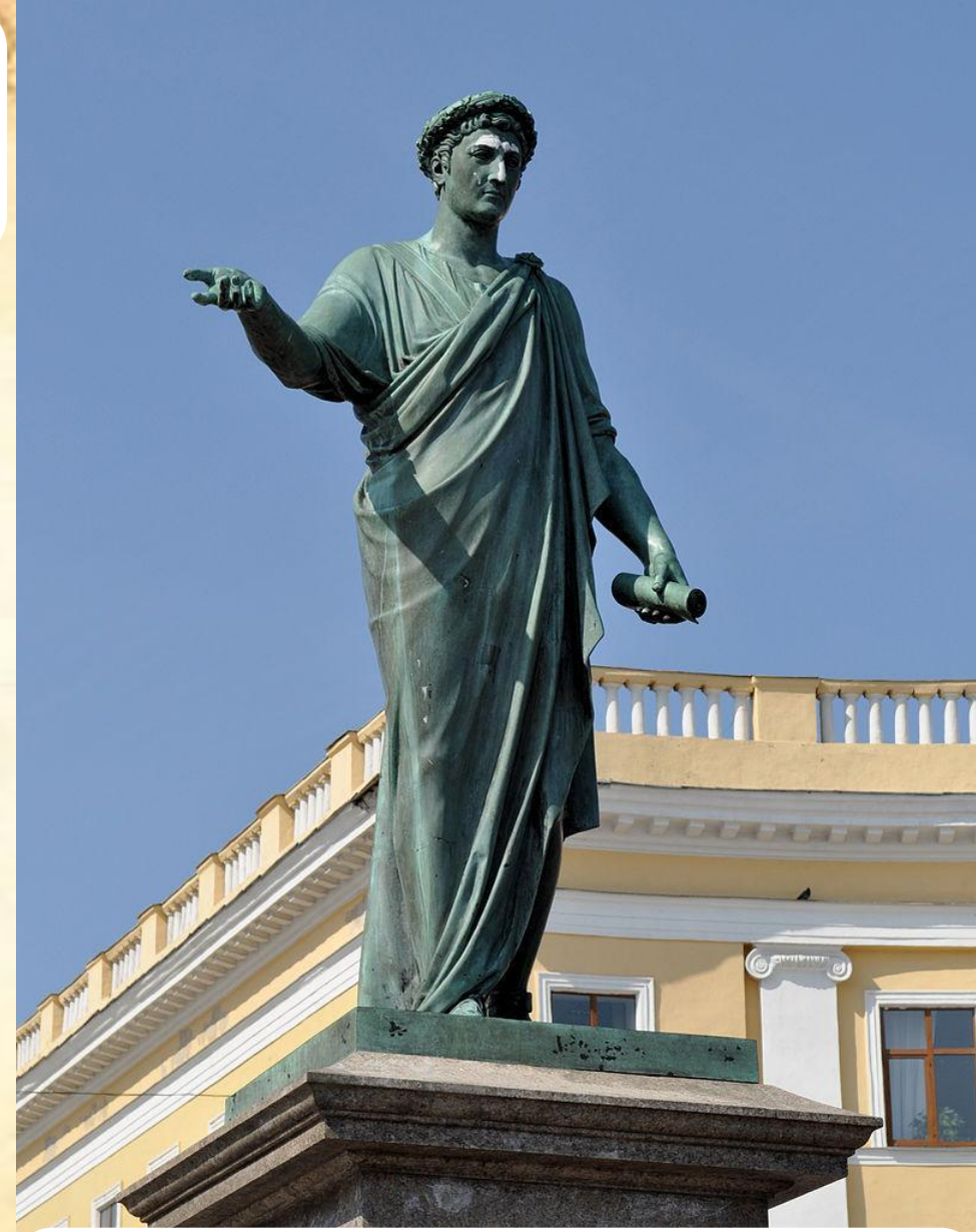
Пам'ятник градоначальнику та генерал-губернатору А. де Рішельє в Одесі. Скульптор І. Мартос. 1828.