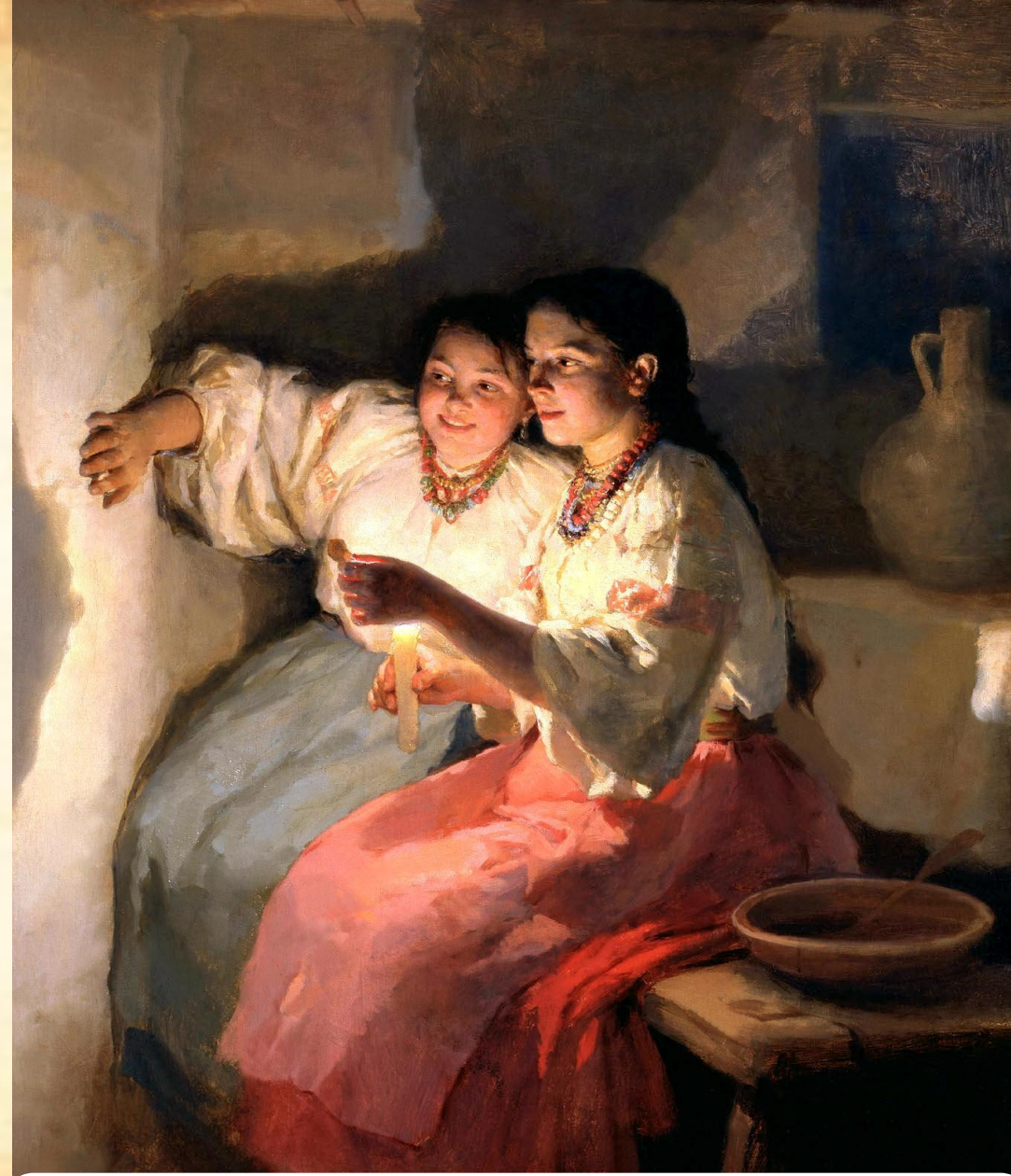
Картина «Святочне Ворожіння». 1888. М. Пимоненко.