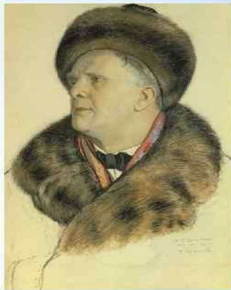
Борис Кустодиев. Портрет Шалыпина.