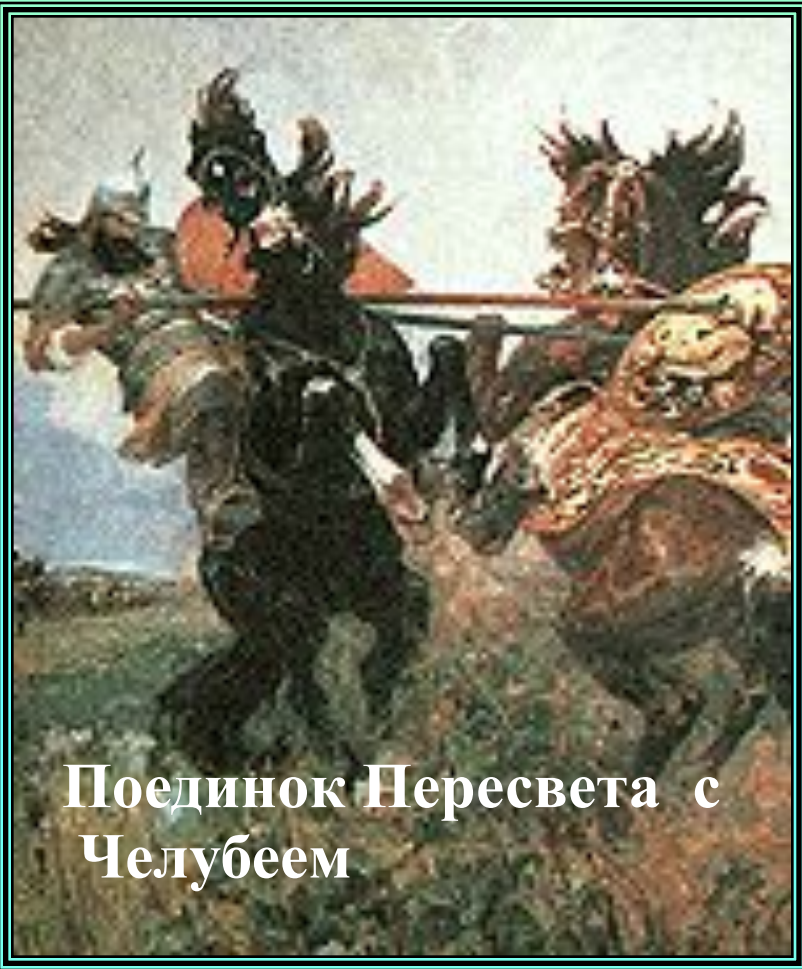
Поединок Пересвета с Челубеем