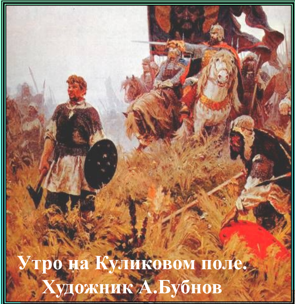
Утро на Куликовом поле. Художник А.Бубнов