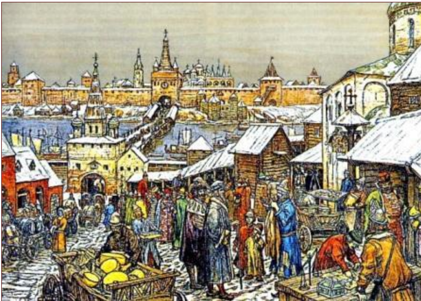
А. Васнецов. Новгородский торг

Из Византии и других стран привозили оружие, дорогие ткани, заморские вина и яства.