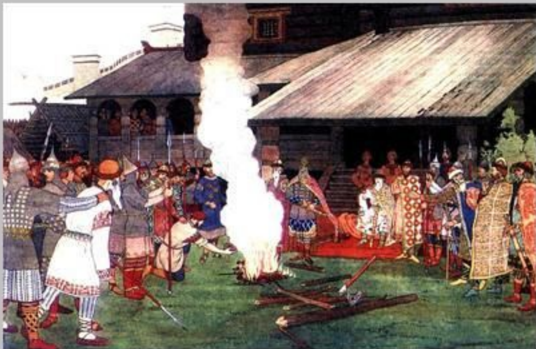
И. Билибин Суд во времена "Русской правды"