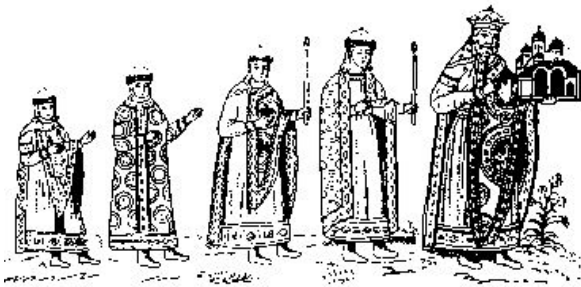
Изображение Ярослава Мудрого и его семья (фреска Софийского собора в Киеве).