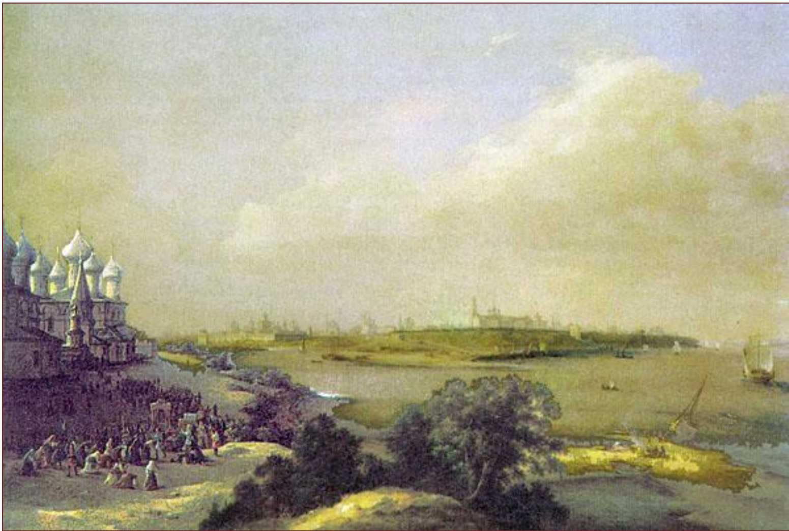
Н. Чернецов. Вид города Ярославля

На Волге Ярослав также построил новый город и назвал его по своему славянскому языческому имени — Ярославль. Город защищал восточные границы Руси.