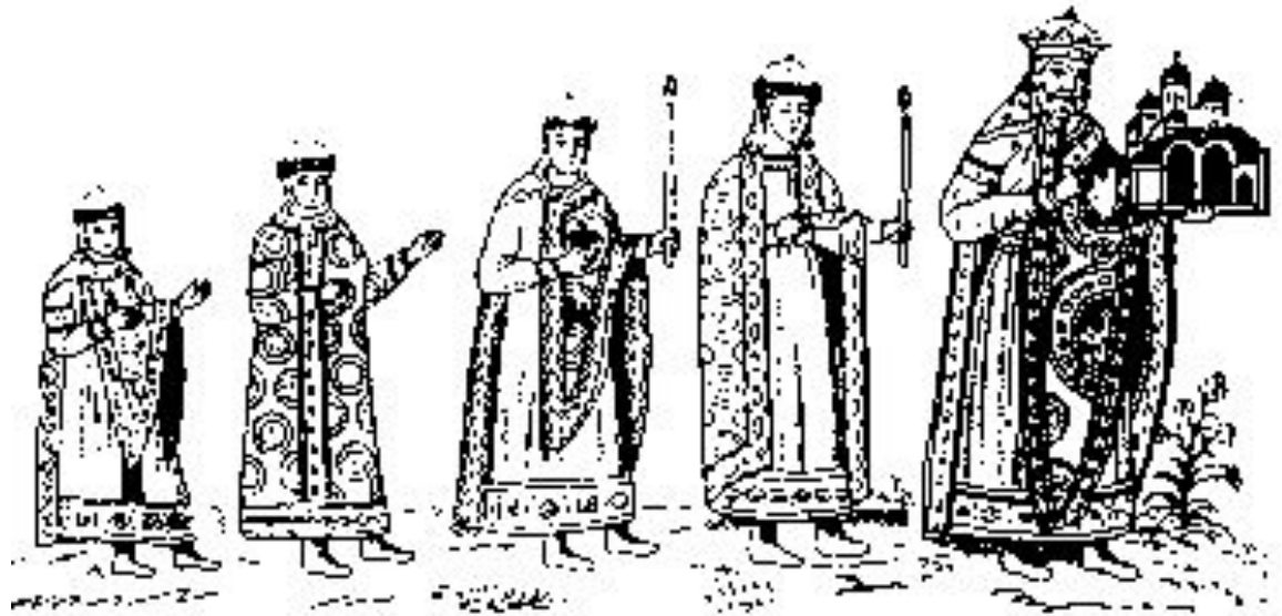
Изображение Ярослава Мудрого и его семьи (фреска Сафийского собора в Киеве).