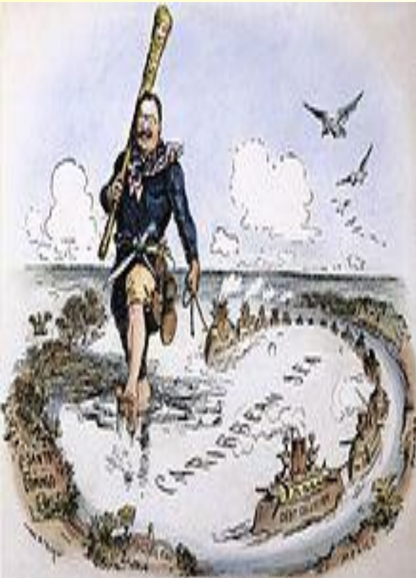
THE BIG STICK IN THE CARIBBEAN SEA