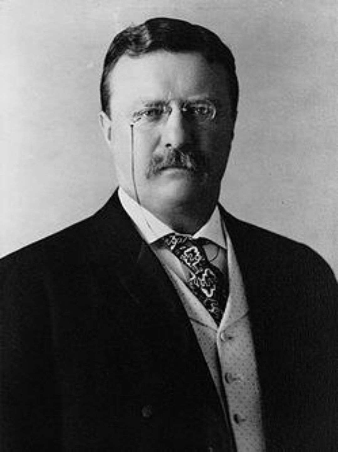
Теодор Рузвельт 26-й президент США 1901-1909 гг.