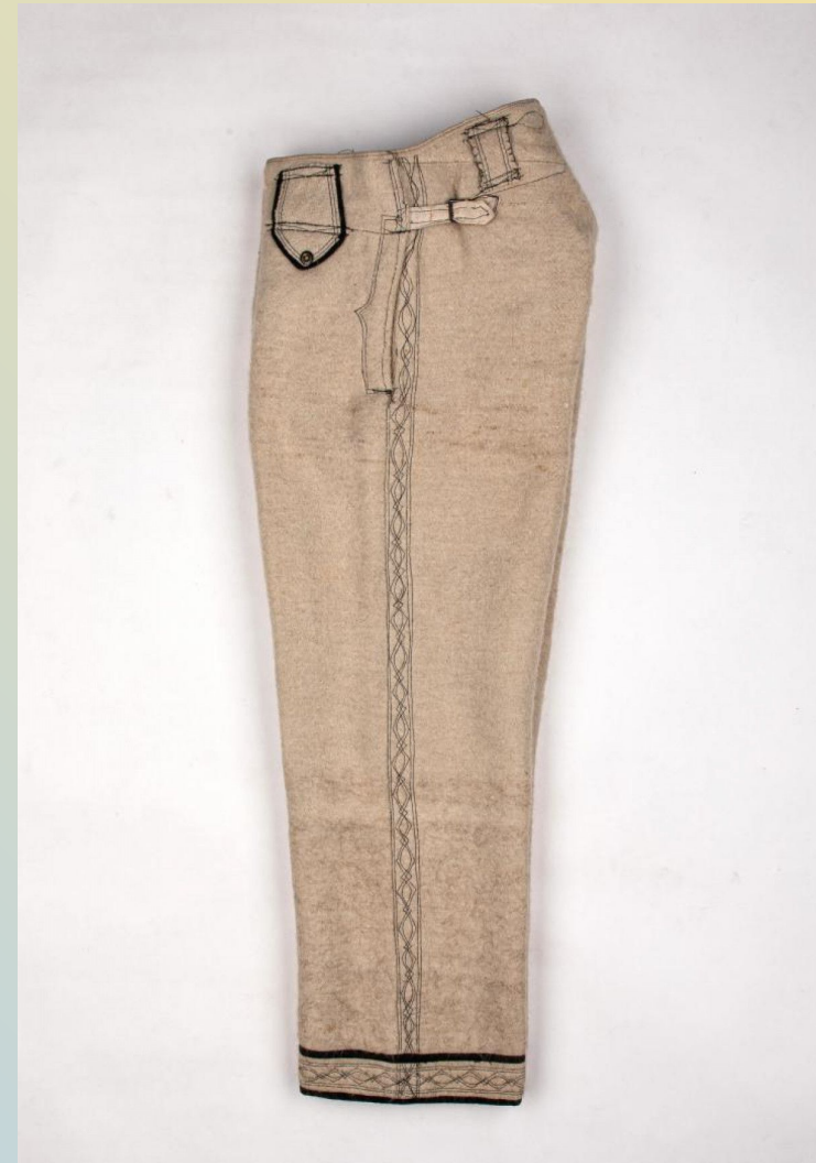
Гачі вишиті на білому сукні

Існували два основні способи носіння натільного й поясного одягу. На території побутування широких штанів сорочка заправлялася в них. З вузькими штанами сорочку носили навипуск.