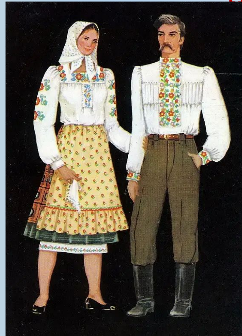
Вінницька та Хмельницька області