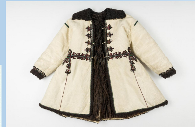
Кожух, оздоблений апликацією