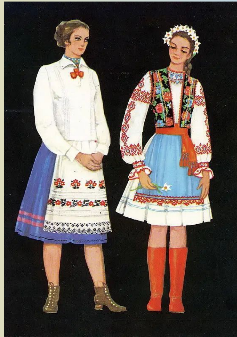
Чернігівська та Закарпатська області