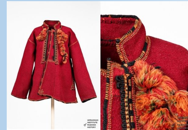
Чоловічий святковий сердак