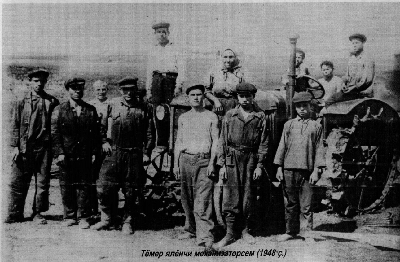
Тёмер ялёнчи механизаторсем (1948 ҫ.)