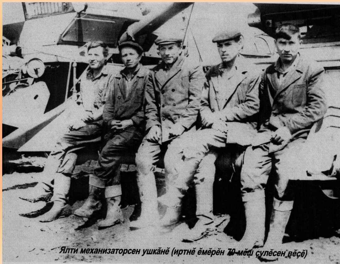
Ялти механизаторсен ушкәнә (иртнә ёмёрен 70-мәш сүлөсен вёсә)