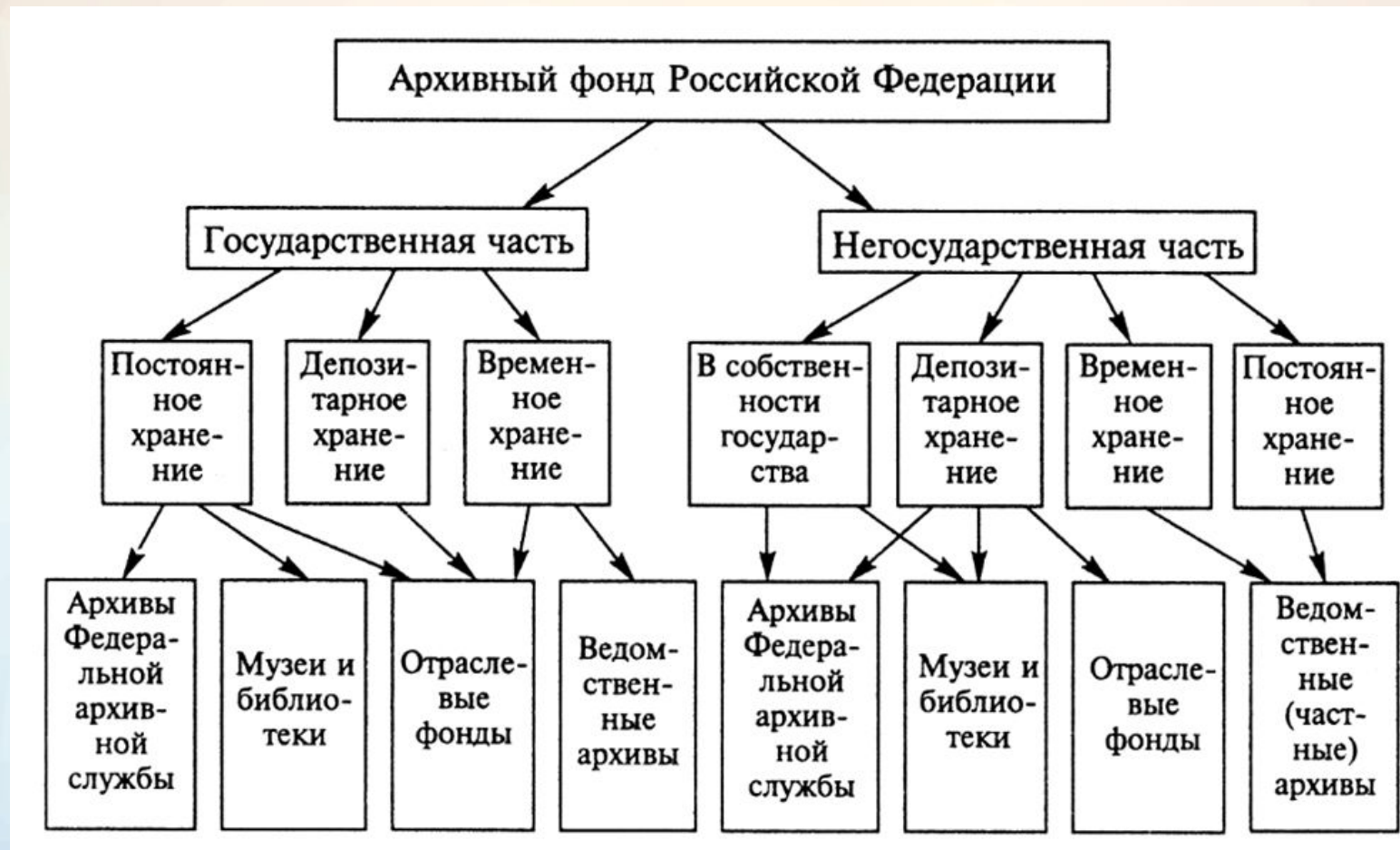
Рис. 2. Современная система архивов