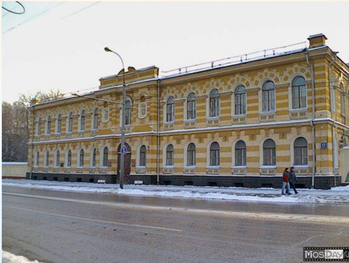
Рис. 4. Российский государственный архив древних актов