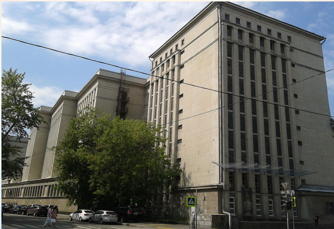
Рис. 3.