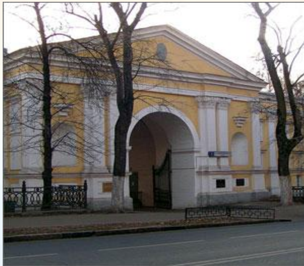
Рис. 6.