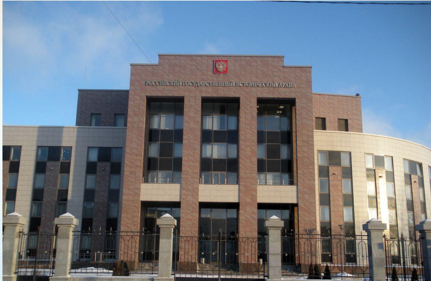
Рис. 5.