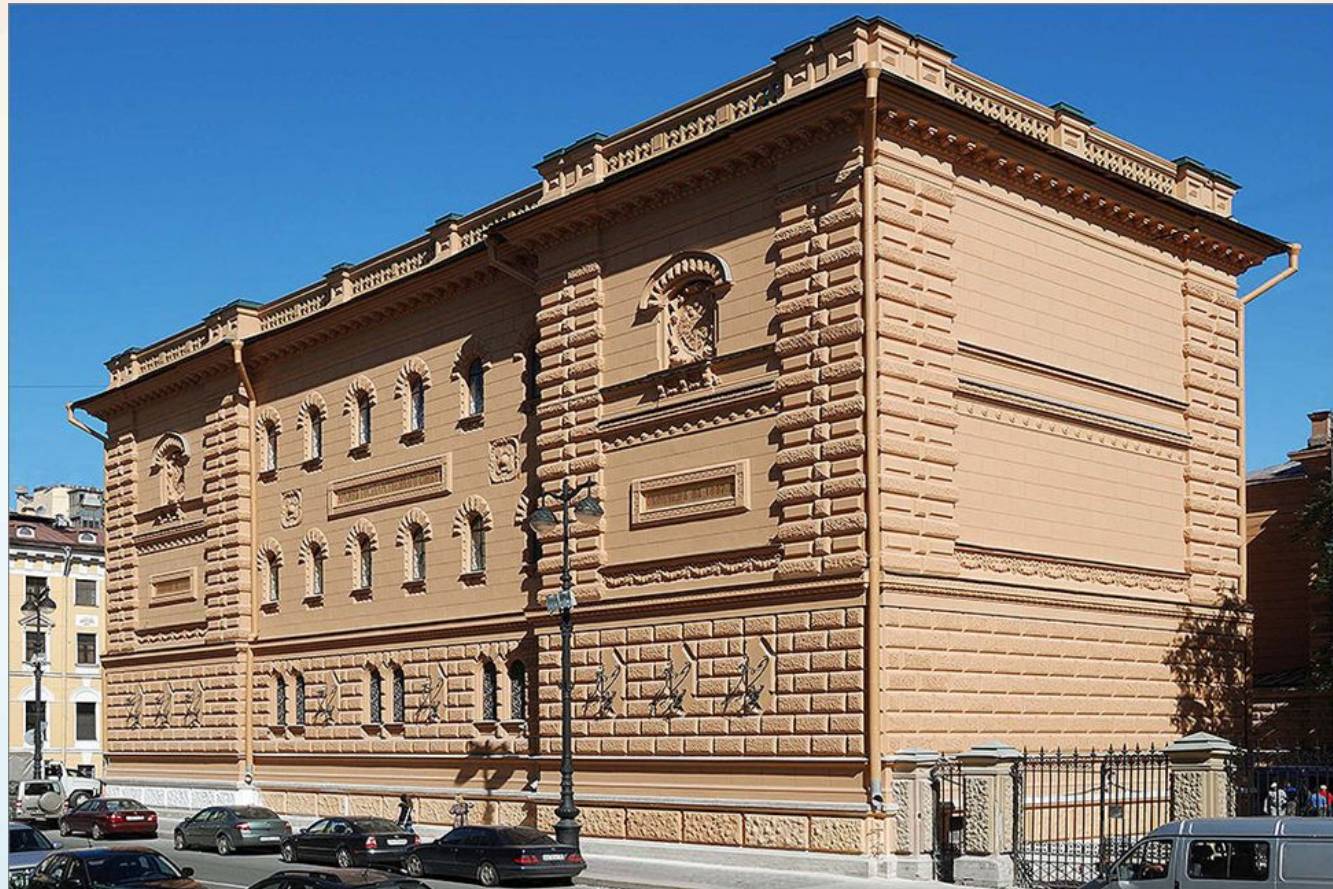
Рис. 7.