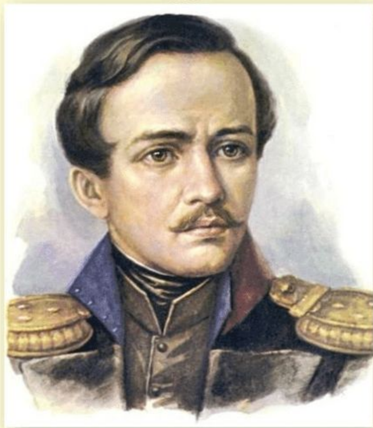
Михаил Юрьевич Лермонтов (1814—1841)