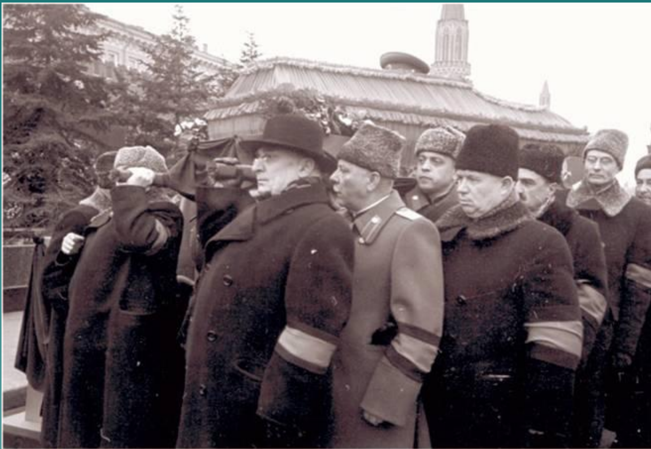
Лидеры СССР на похоронах Сталина. 1953