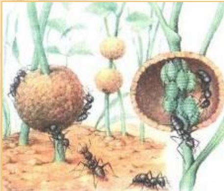
Тля и муравьи