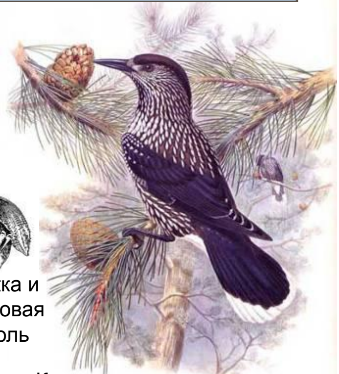
Кедровка и кедровая сосна