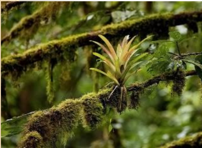
Буревестник и гаттерия в одной норе

Использование одними видами жилища других видов