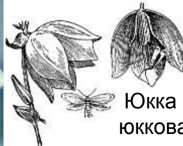
Юкка и юкковая моль