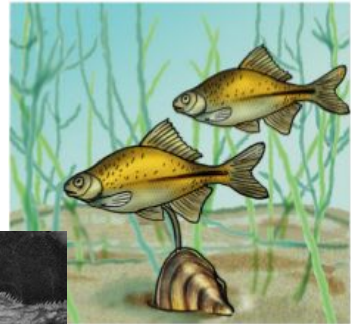
Рыба горчак и двустворчатый моллюск