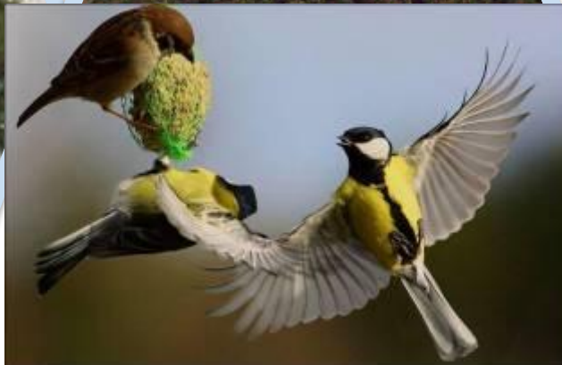
Травоядные насекомые и млекопитающие (за пищевой ресурс)