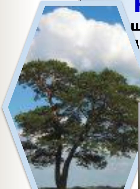
Воробьи и синицы (за место гнездования)