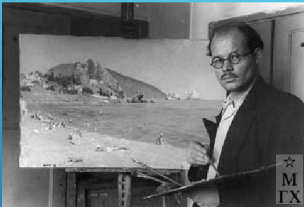
Виктор Григорьевич Цыплаков 1915-1986 гг