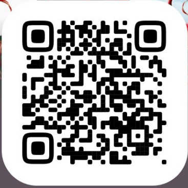
Чарлі і шоколадна фабрика