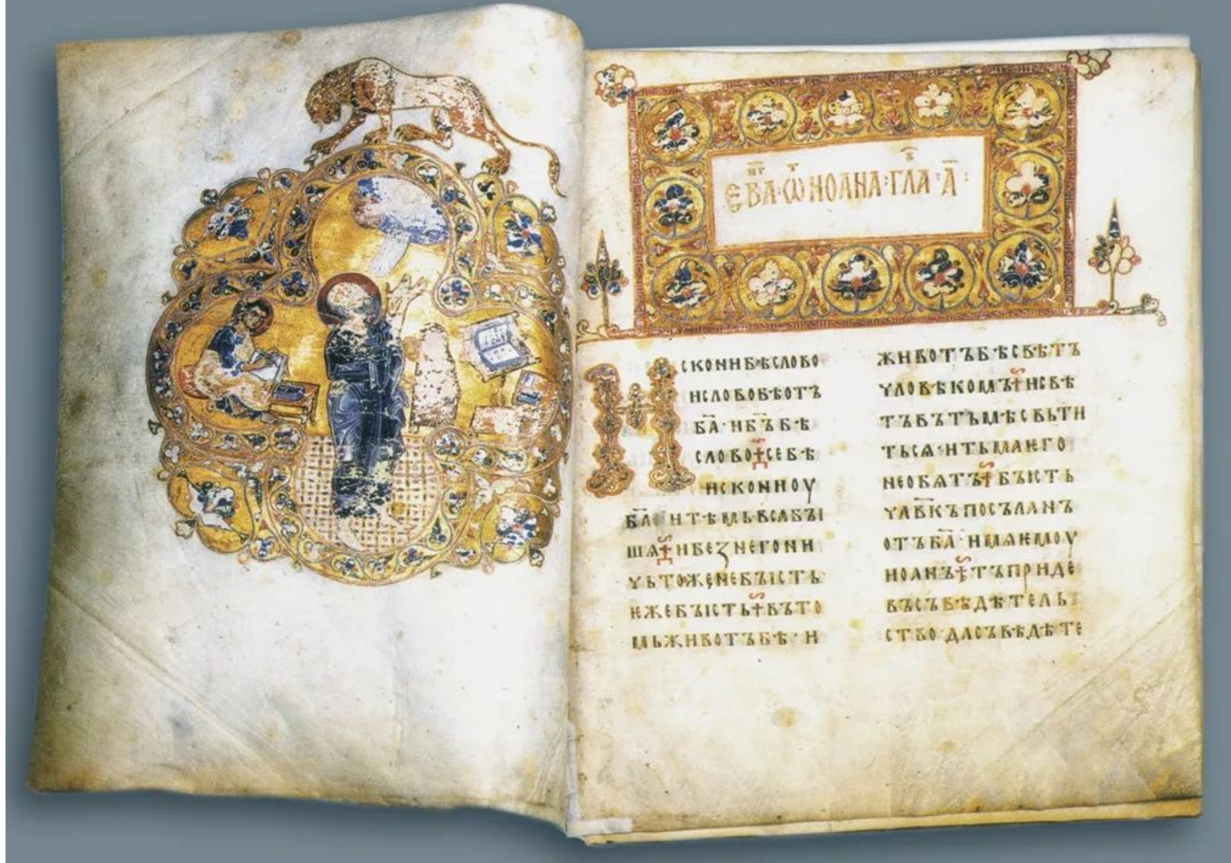
Остромирово Евангелие, сер. XI века