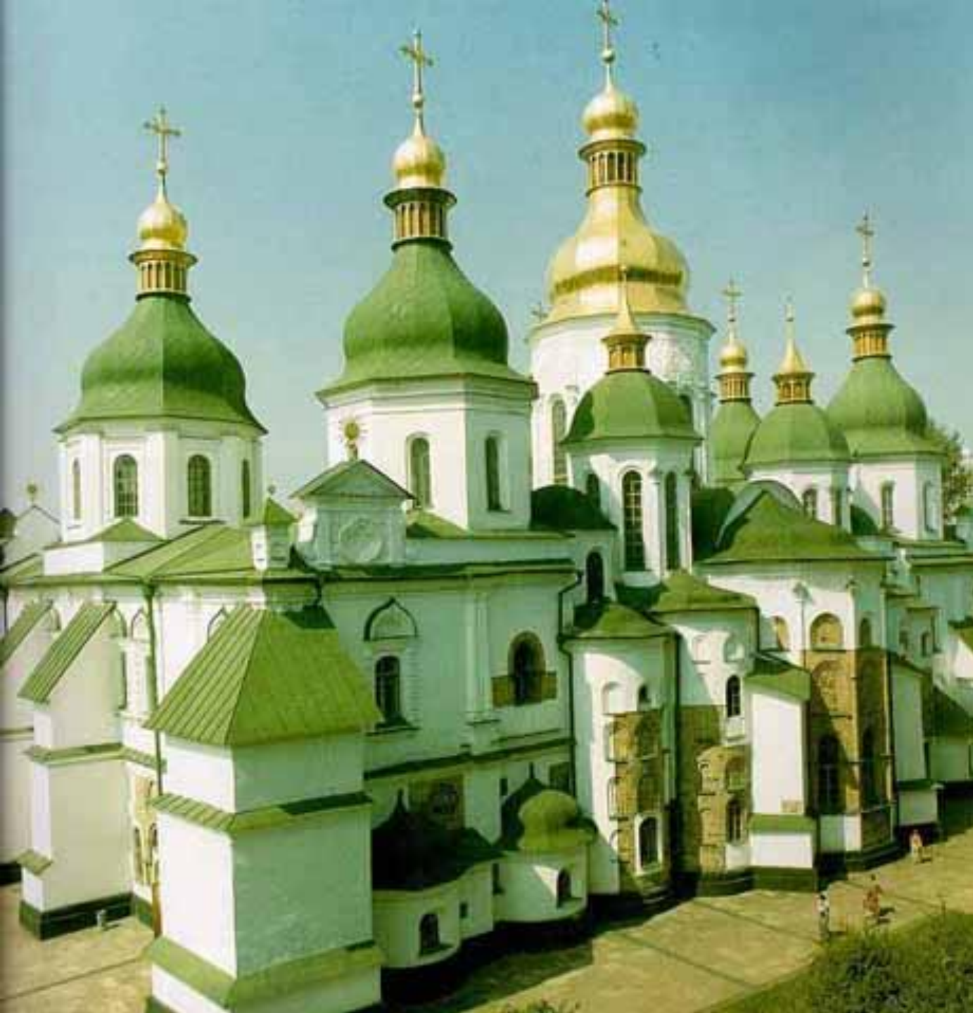
Софийский собор в Киеве 1037-1041 гг. Современ- ный вид