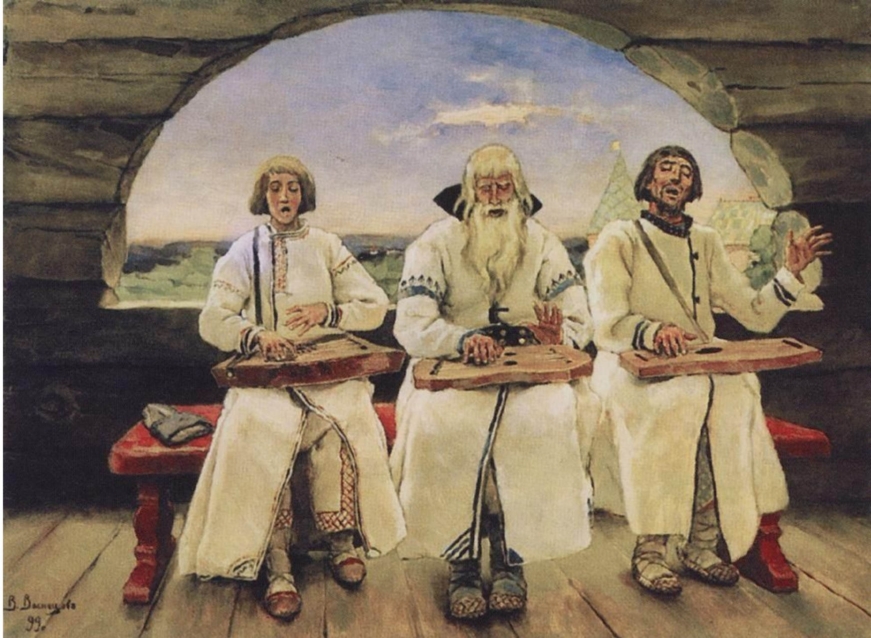
Виктор Михайлович Васнецов «Гусляры». 1899