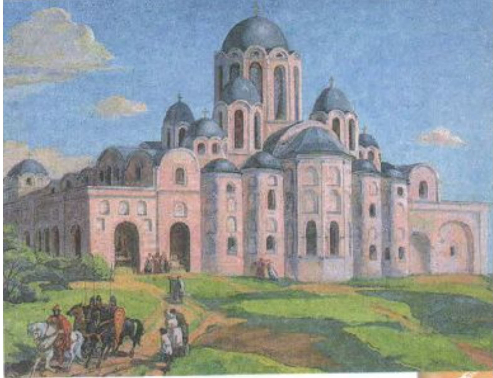
Софийский собор в Киеве. XI в. Реконструкция первоначального вида