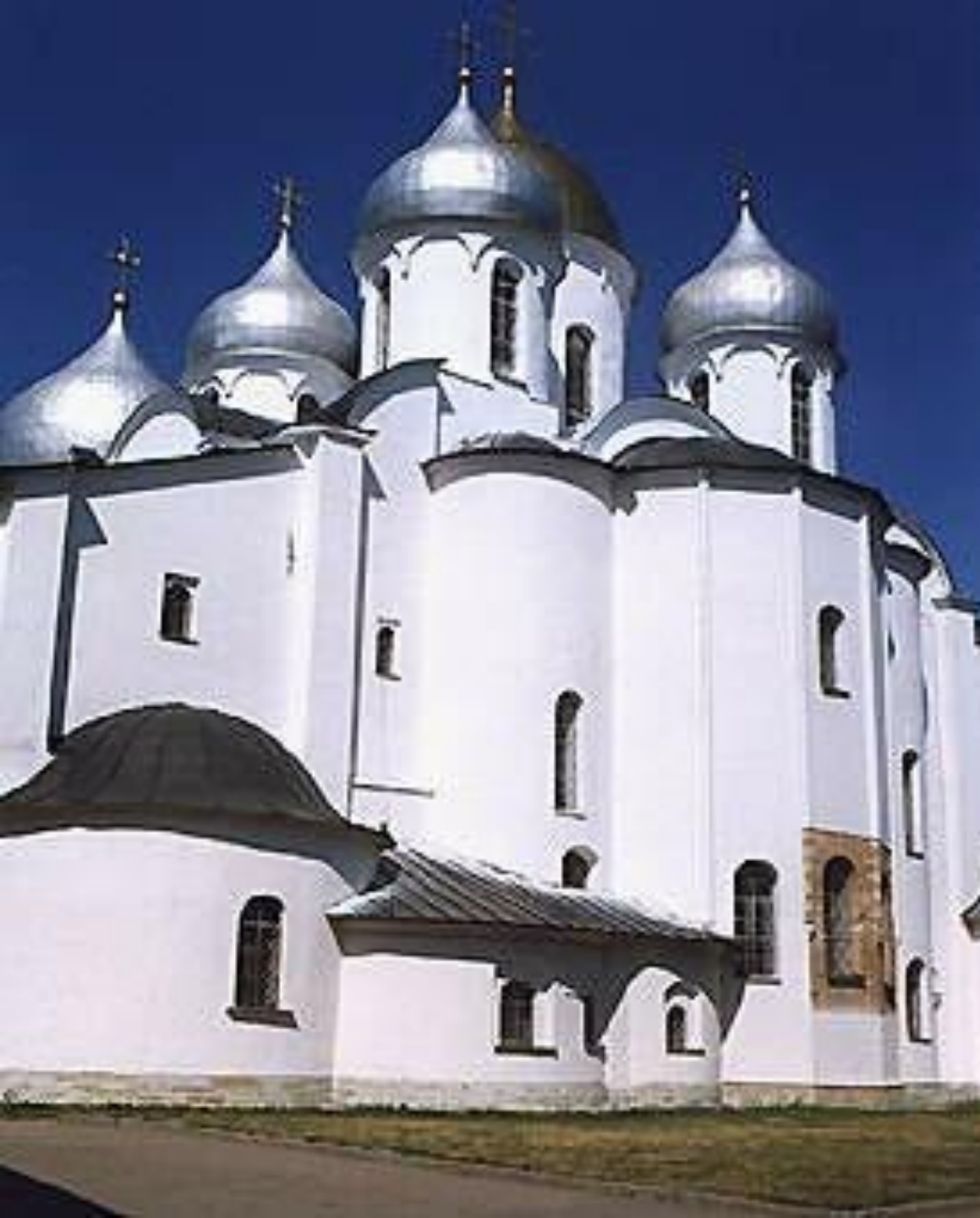
Софийский собор в Великом Новгороде 1045-1050 гг.