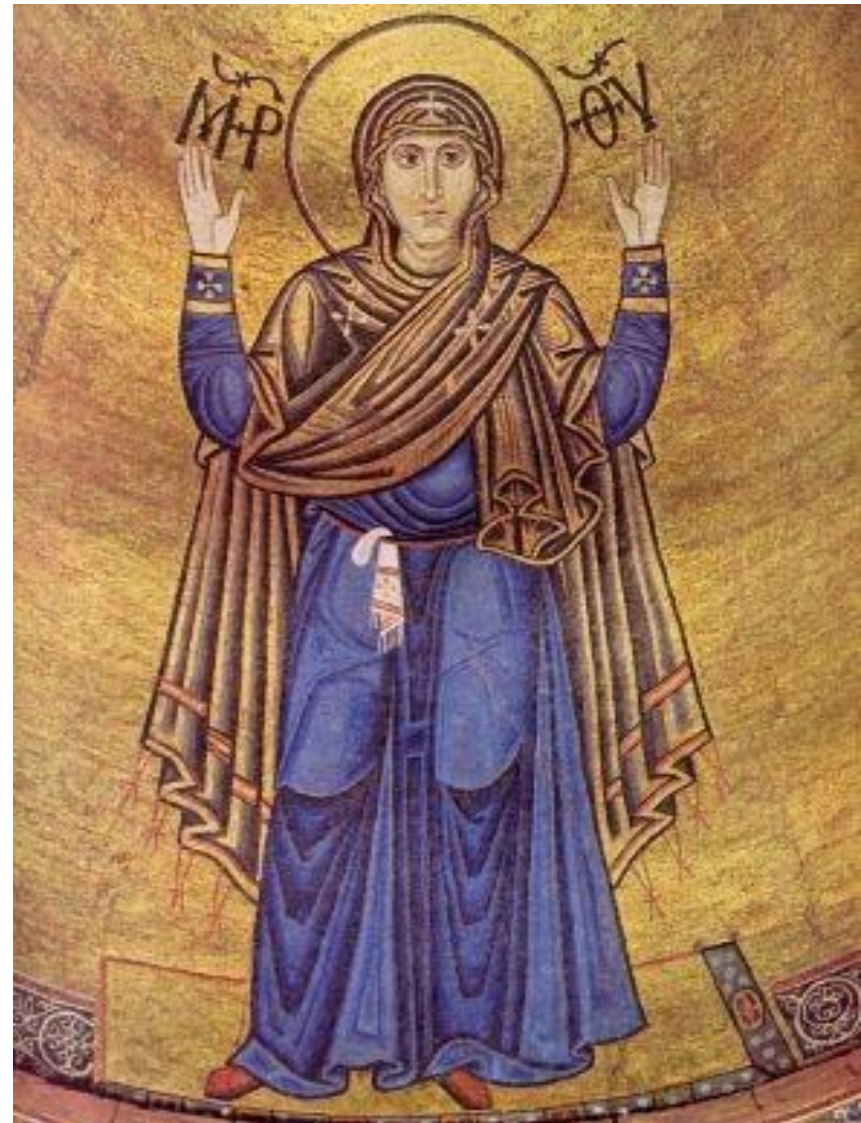
Интерьер Софии Киевской