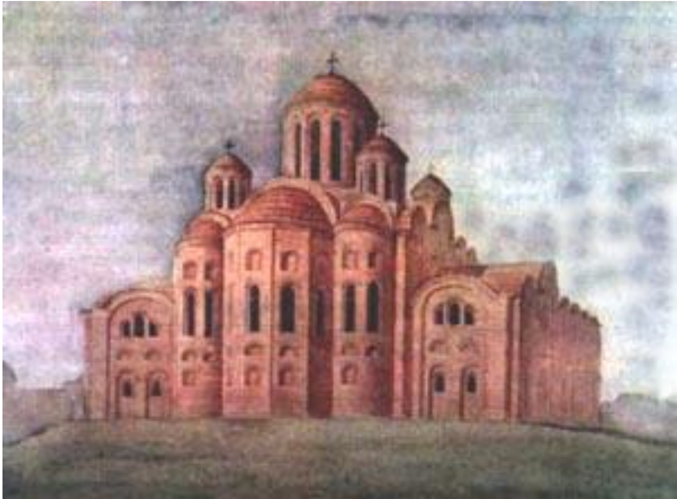
Десятинная церковь в Киеве 989-996 гг.