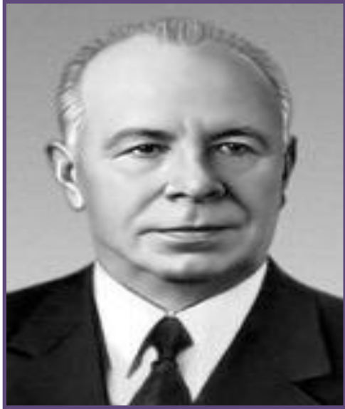
Н.В. Подгорный – Председатель Президиума Верховного Совета СССР