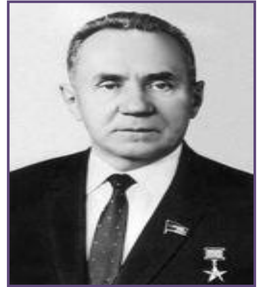
А.Н. Косыгин – Председатель Совета Министров СССР