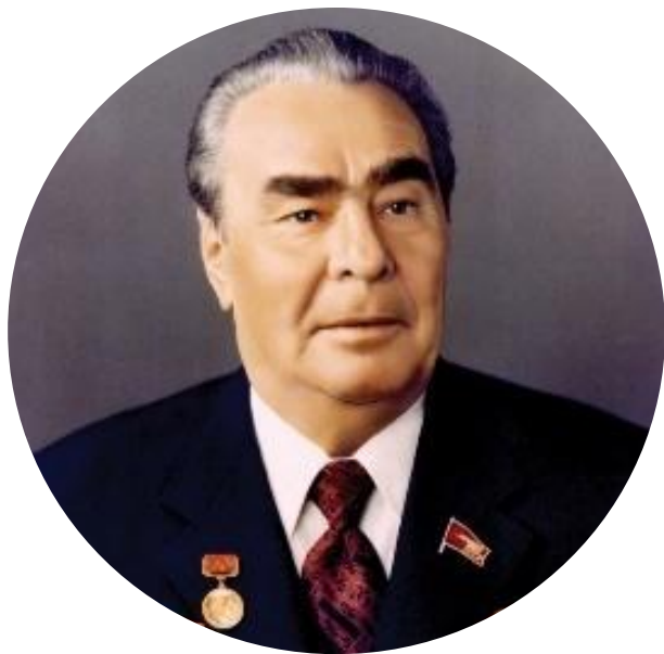
Леонид Ильич Брежнев