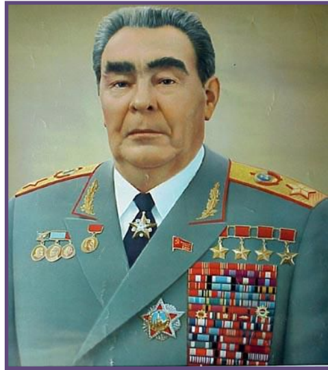
Л.И. Брежнев – Генеральный секретарь ЦК КПСС