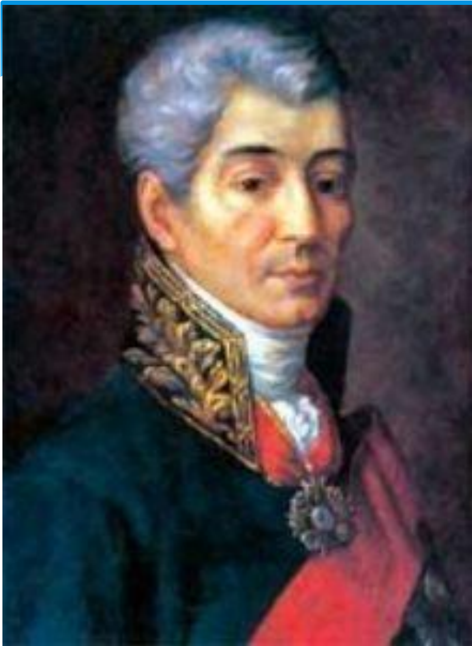
Иван Иванович Дмитриев (1760 – 1837)