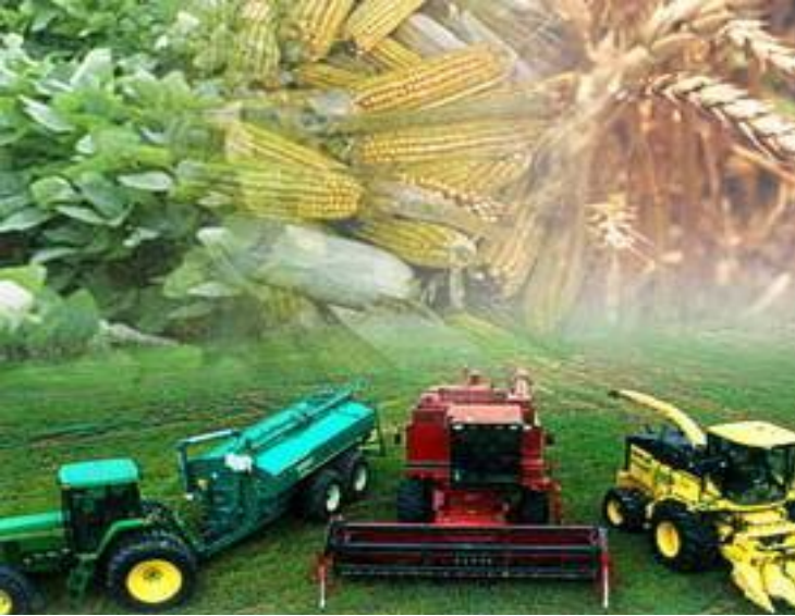
Рис: это основной продукт питания который не может отсутствовать на столе бразильской семьи.

Апельсины: Сан Пауло является одним из основных штатов по количеству апельсиновых плантаций, за ним следуют Парана и Минас-Жерайс. Бразилия является самым крупным производителем и экспортёром апельсиновых соков, главным образом в США.