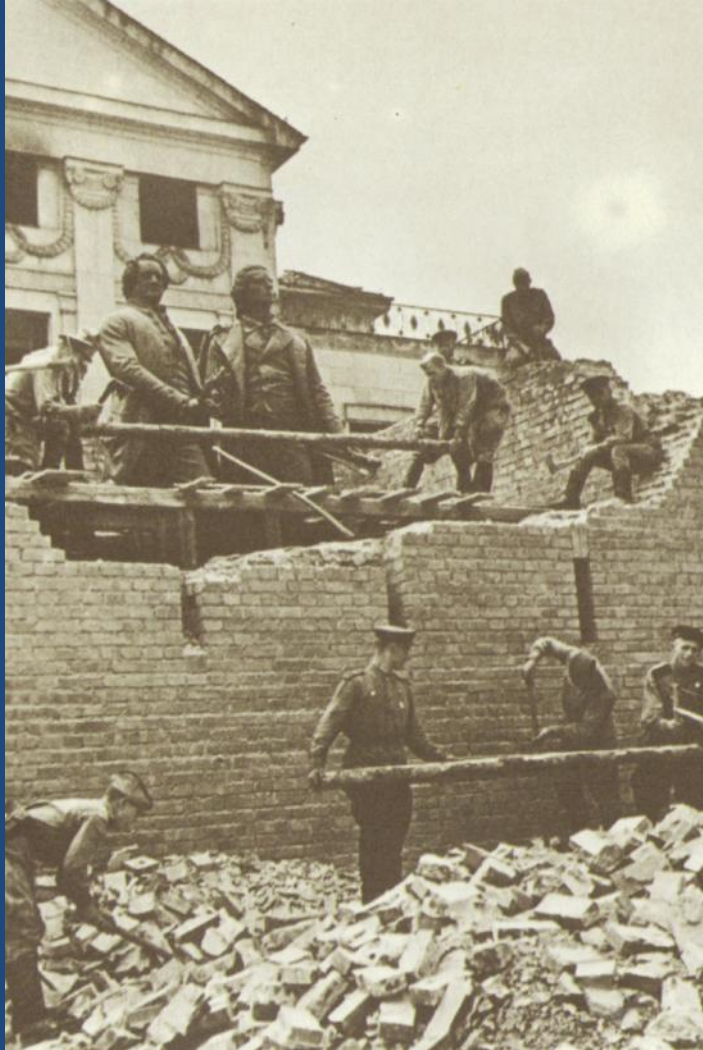
Советские бойцы разбирают укрытие, в котором находились памятники Гёте и Шиллеру. Германия, Веймар. 1944 г.

Бойцы притихли. Звучит музыка Чайковского. Германия. 1945 год.