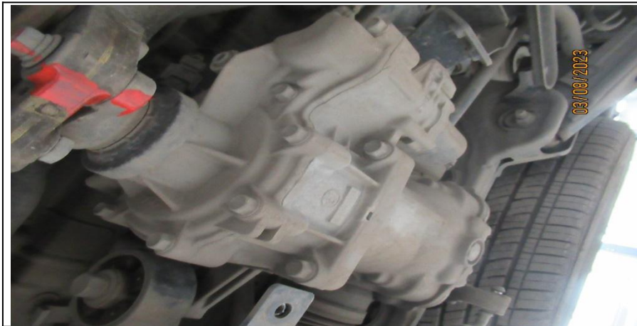
Муфта общий вид, отсутствие течи масла