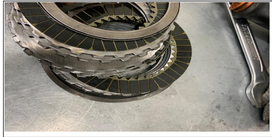
Общий вид пакета