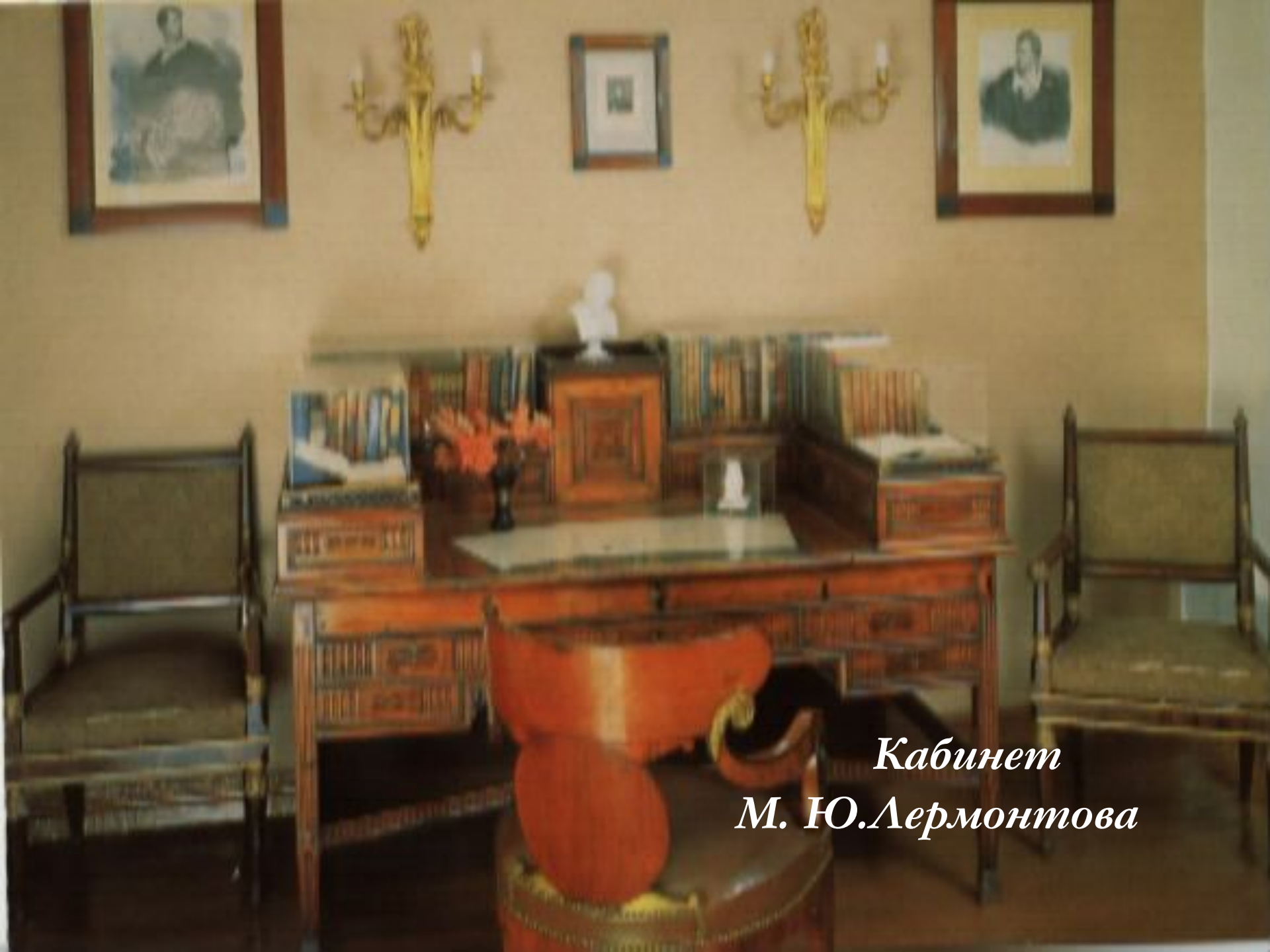
Кабинет М. Ю. Лермонтова