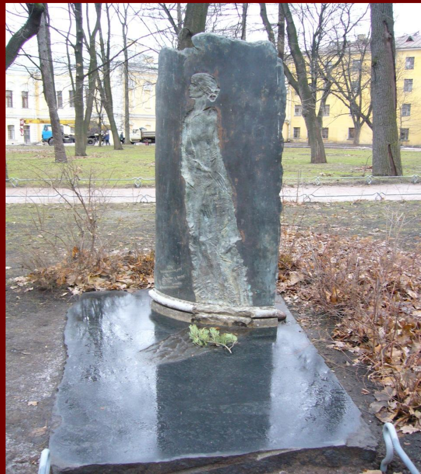
Памятник поэтессе во дворе Фонтанного дома