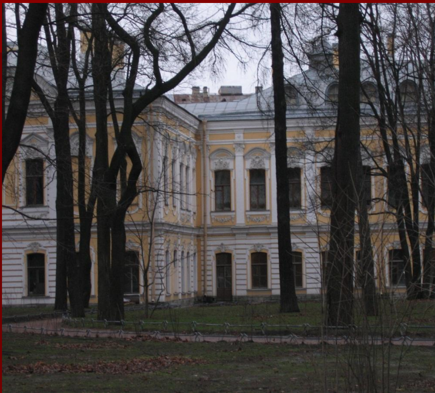
Музей А. Ахматовой в Фонтанном доме