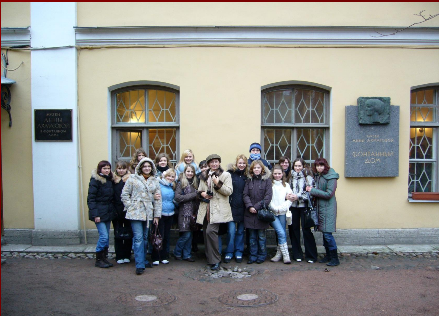
Студенты технического колледжа в музее Анны Ахматовой