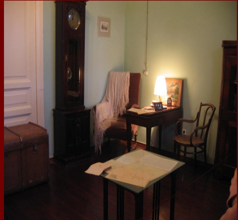
Комната в Фонтанном доме, где Ахматова находилась под домашним арестом в 1946г.

Ахматова навлекает на себя гнев Сталина, узнавшего о визите к ней английского историка И. Берлина. Кремлевские власти делают Ахматову наряду с М.М. Зощенко главным объектом партийной критики; направленное против них постановление ЦК ВКП(б) «О журналах «Звезда» и «Ленинград» (1946) ужесточило идеологический диктат и контроль над советской интеллигенцией, введенной в заблуждение раскрепощающим духом всенародного единства во время войны. Снова возник запрет на публикации; исключение было сделано в 1950, когда Ахматова симитировала верноподданнические чувства в своих стихах, написанных к юбилею Сталина в отчаянной попытке смягчить участь сына, в очередной раз подвергшегося заключению.