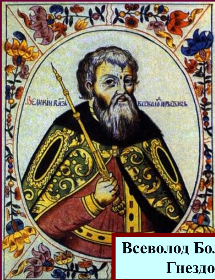
Всеволод Большое Гнездо