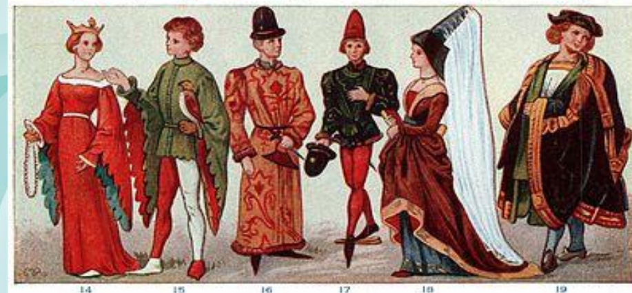
DRESS OF ANCIENT PERIOD (SEE DESCRIPTION FOLLOWING)