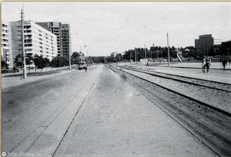
← Улица Маршала Казакова в 1989 году