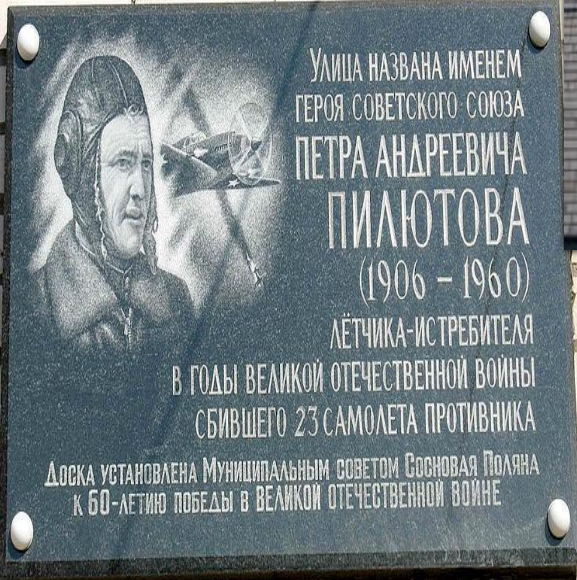
Памятная доска П.А. Пилютову установлена на доме №36