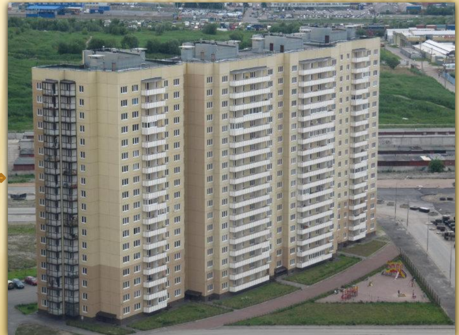
Многоквартирный жилой дом Ул. Маршала Казакова, 44 →