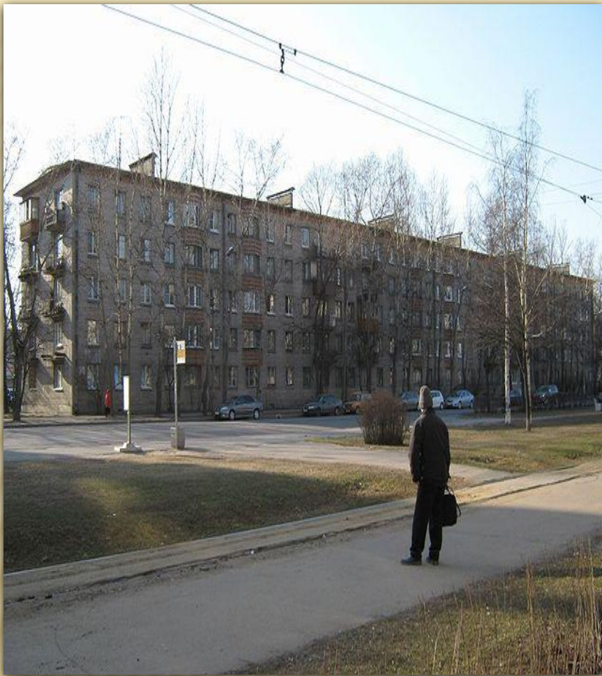
улица Пограничника Гарькавого