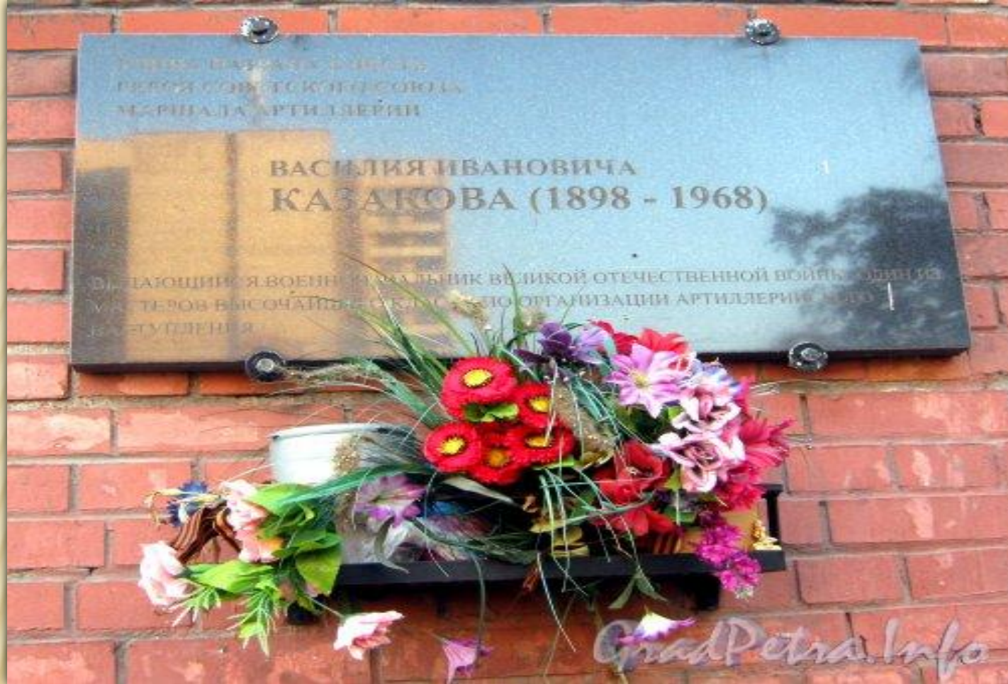
Памятная табличка В.И.Казакову установлена на доме 16