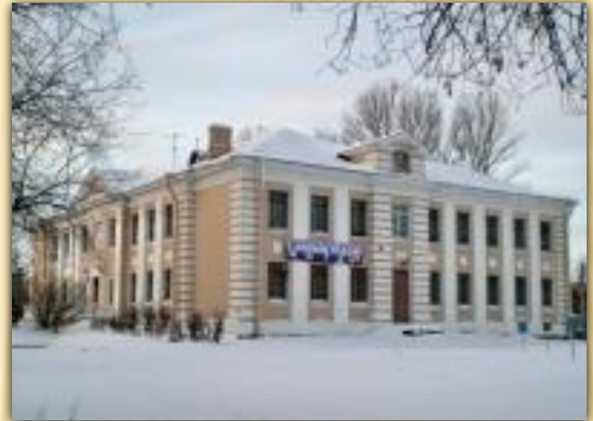
Дом детского и юношеского творчества Красносельского района Пограничника Гарькавого ул., 11