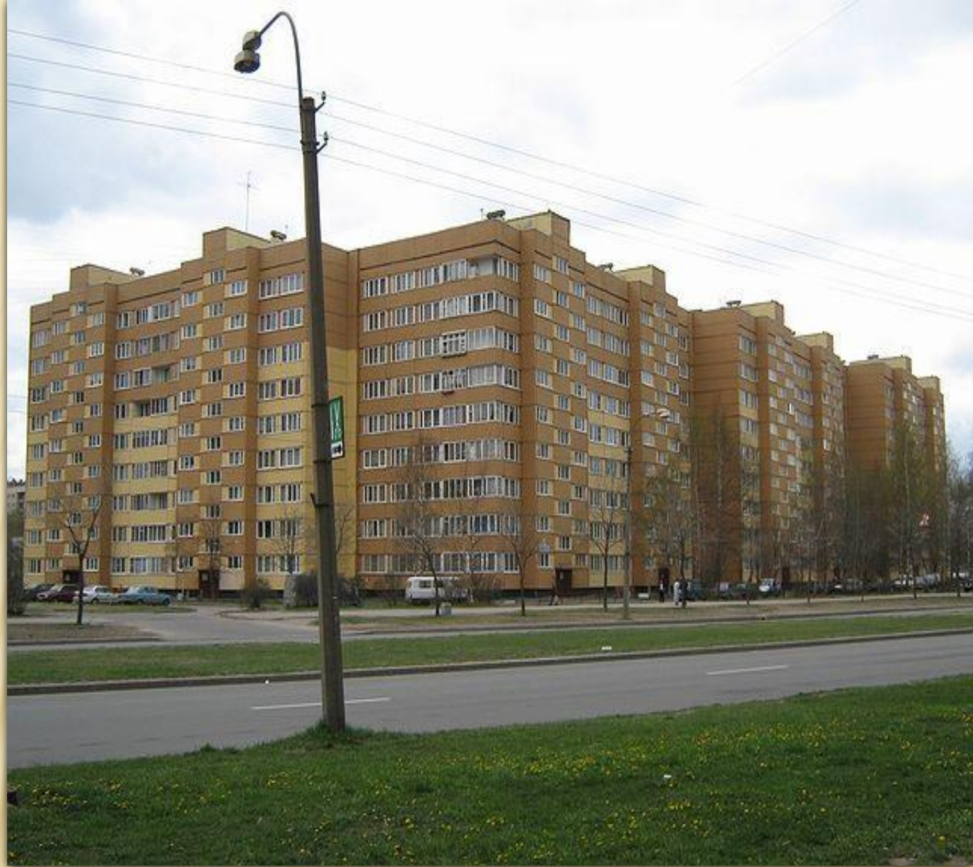
Улица Маршала Захарова