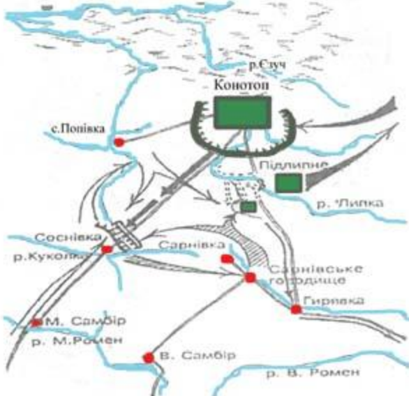
Карта бою під Конотопом (укладена Іваном Лисим)

московський цар закликав до непокори гетьманові, гетьман розіслав «Звернення до європейських дворів», яким сповіщав про розрив із Москвою та про його причини.