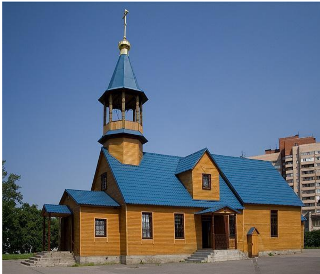
Храм св. Петра митрополита Московского на пр. Стачек