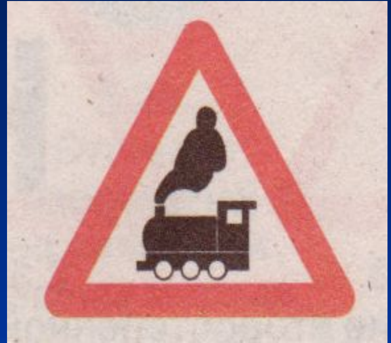
Железнодорожный переезд без шлагбаума