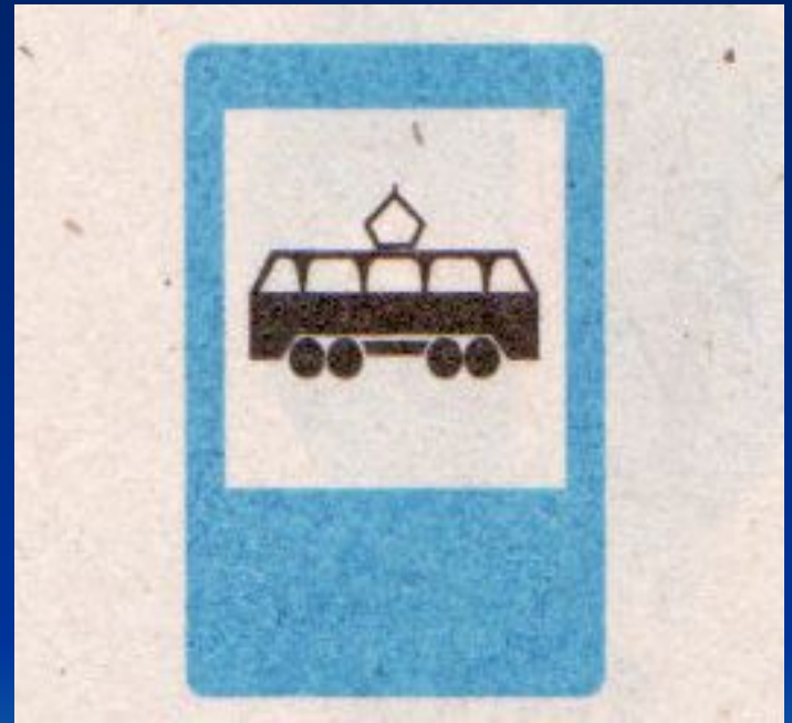
Место остановки трамвая