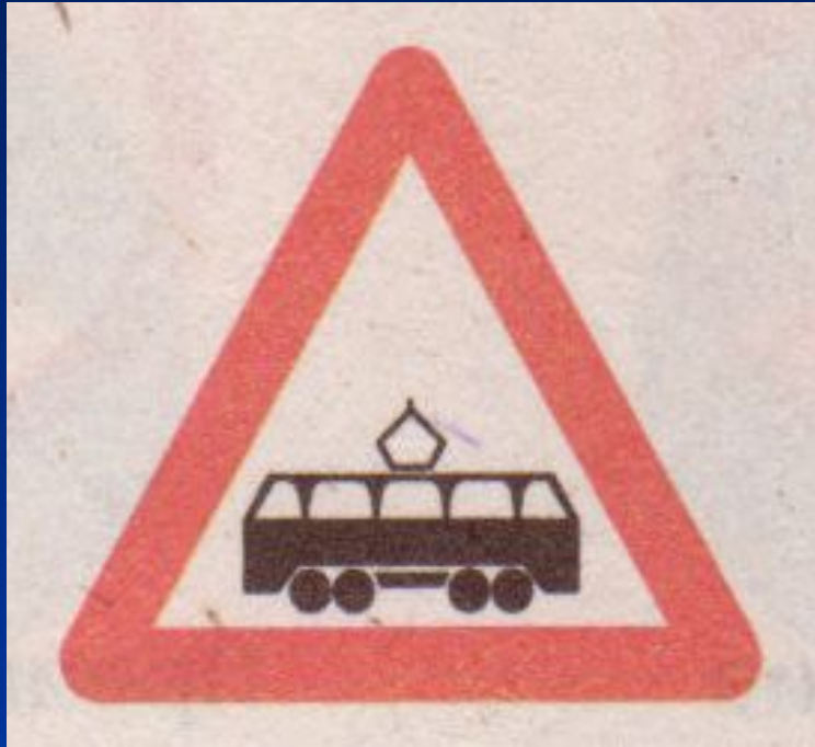
Пересечение с трамвайной линией