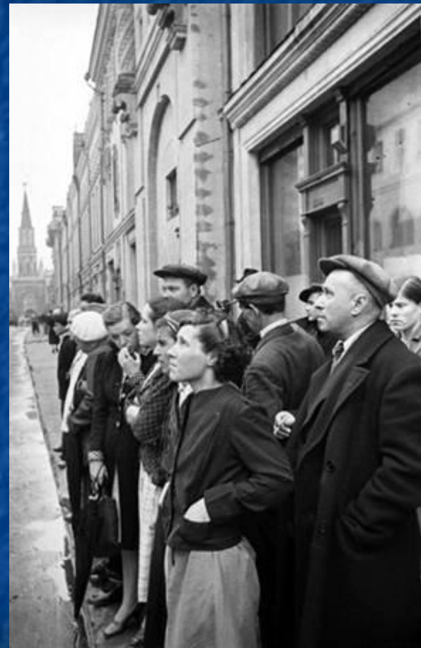
Е. Халдей. Москва. 22 июня 1941 г.