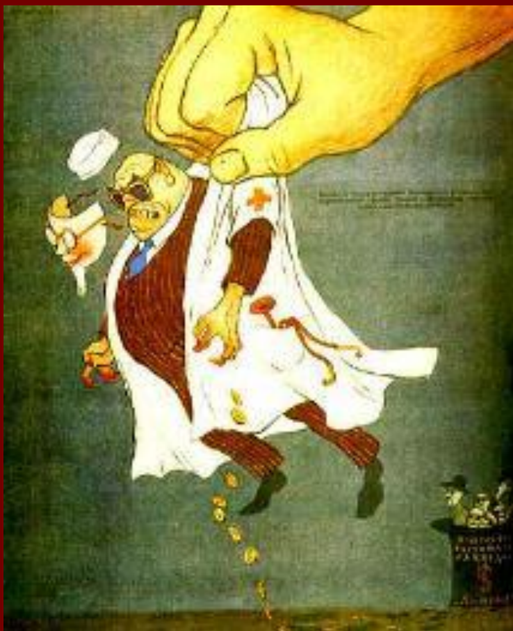
Разоблачение «врачей-убийц». Плакат 1952 г.

В 1948 г. было сфабриковано «ленинградское дело». На скамье подсудимых оказались руководители ленинградской партийной организации А.А. Кузнецов, Н.А. Вознесенский, М.И. Родионов, П.С. Попков и др., их признали виновными в создании антипартийной группы и вредительско-подрывной работе. Часть осужденных приговорили к расстрелу, часть – к тюремному заключению; из Ленинграда выселили несколько тысяч человек партийных и советских работников и членов их семей.