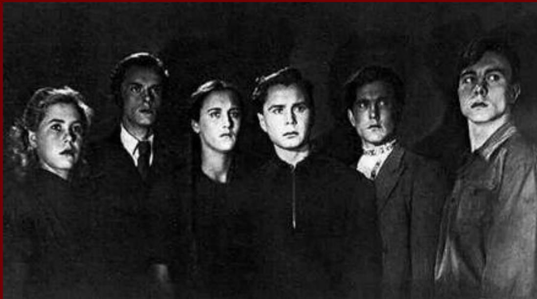
Кадр из фильма С.Герасимова «Молодая гвардия»

В кинематографе яркими событиями стали «Молодая гвардия» С. Герасимова, «Повесть о настоящем человеке» А.Столпера, «Весна» Г.Александрова и др. В тоже время резкой критике подверглись: 2-я серия «Ивана Грозного» С.Эйзенштейна, «Адмирал Нахимов» В.Пудовкина, «Большая жизнь» Л.Лукова. Эти фильмы на долгие годы были положены на полку и не выходили на большие экраны.