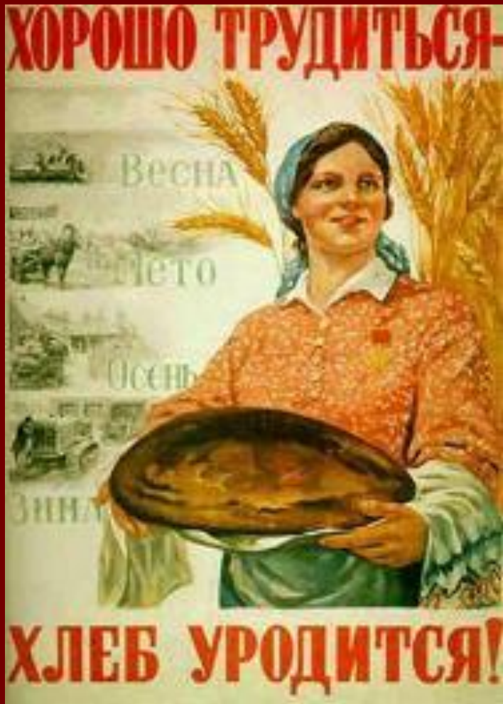
М.Соловьев. Плакат 1947 г.

В 1946 г. сократили размер ЛПХ, в 1947-1948 гг. повысили налоги на ЛПХ.