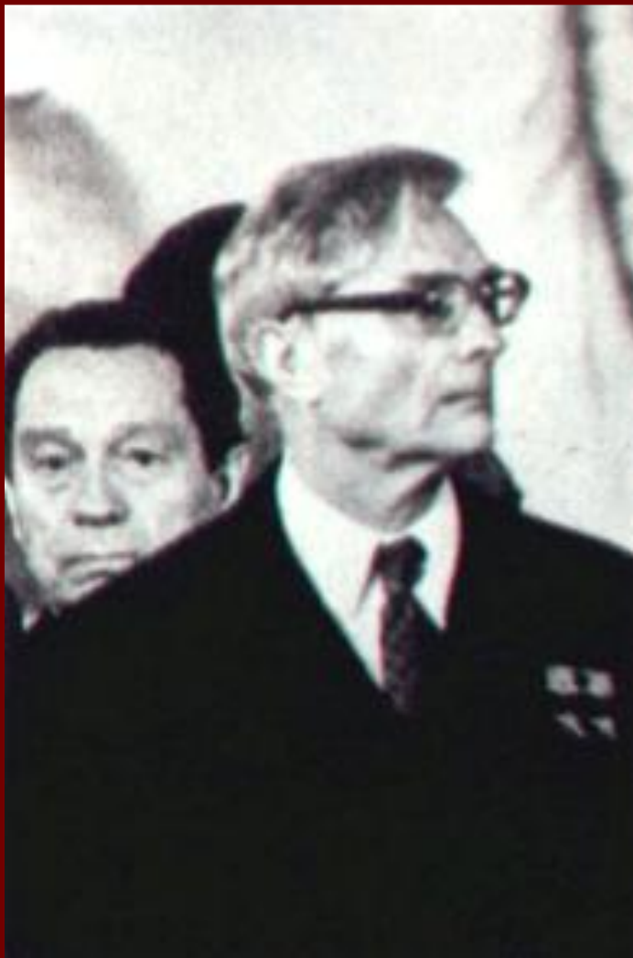
Секретарь ЦК по Идеологии М.А.Суслов.

В феврале 1945 г. новым патриархом стал Алексей I. Он продолжил линию на поддержку государства в разгроме врага. В 1944-48г. власти разрешили приходам открывать новые храмы. Вскоре были открыты Московский богословский институт, духовная академия и семинария. Но в 1947 г. М. Суслов подготовил по становление ЦК об атеистической работе и гонения на церковь возобновились.