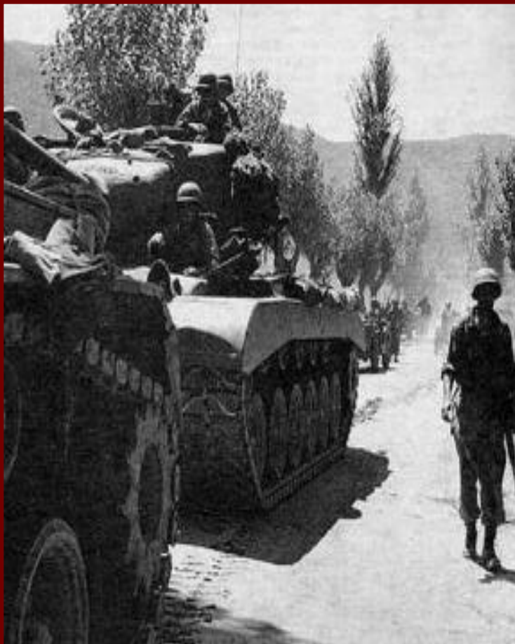
Американские войска в Южной Корее.

Высадившись в Чемульпо, союзники стремительно освободили захваченные территории и вторглись в Северную Корею. КНДР обратилась за помощью к Китаю и Советскому Союзу. Получив советскую технику и помощь Китайской армии, северяне выровняли линию фронта, и в 1954 г. был подписан мирный договор, подтвердивший разделение страны на Южную Корею и КНДР. Корейская война показала, как легко «холодная» война может перерасти в «горячую».