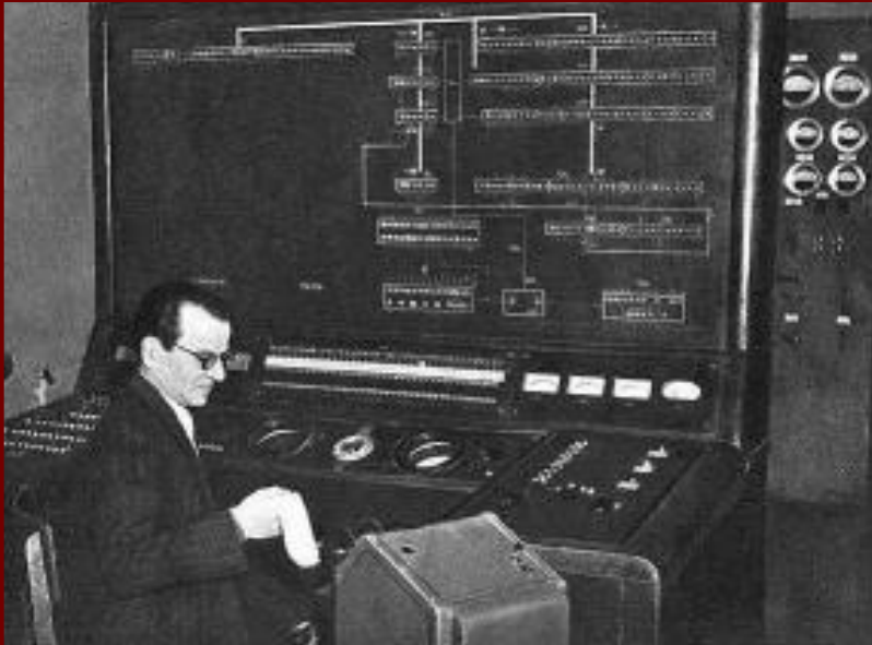
Академик С.Лебедев у счетной машины.

С.Королев успешно работал над созданием управляемых ракет. В 1949 г. была запущена высотная геофизическая ракета.