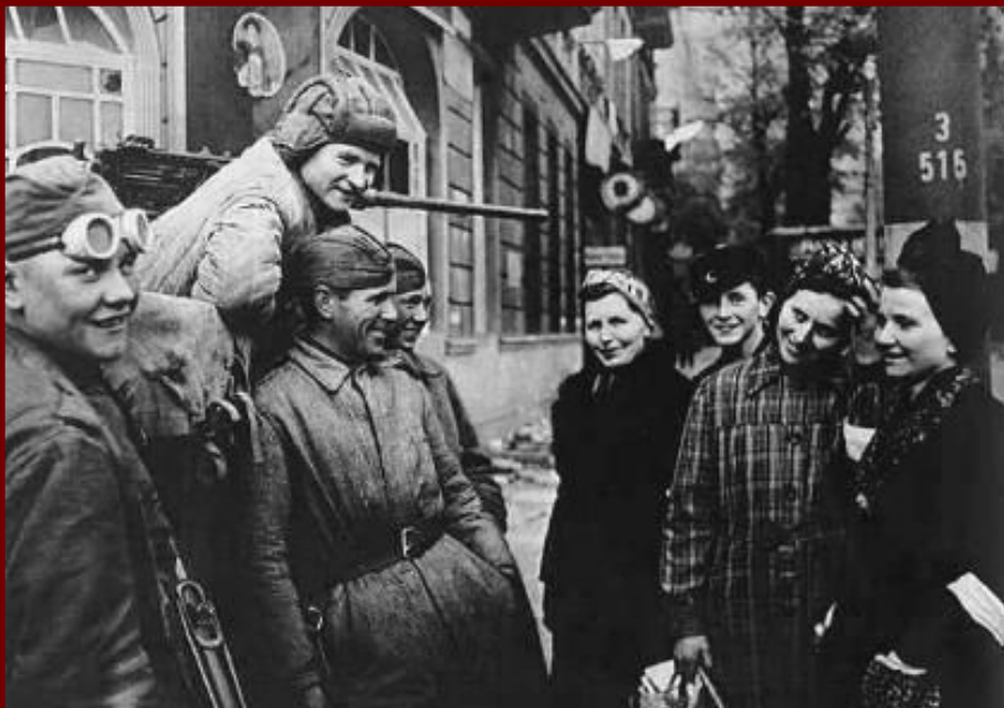
Берлин. Первый день мира.

Война изменила общественно-политическую атмосферу общества, она пробила брешь в «железном занавесе». Западный образ жизни, увиденный во время освободительного похода в Европу породил сомнения в правильности выбранного государством пути. Победа породила надежды: крестьян — на роспуск колхозов, интеллигенции — на ослабление политического диктата, нерусского населения — на изменение национальной политики. В партии вследствие войны — рост численности (к 1945 г. было 6 млн. человек), иллюзии демократизации (требования созыва съезда партии, развития внутрипартийной демократии и пр.).