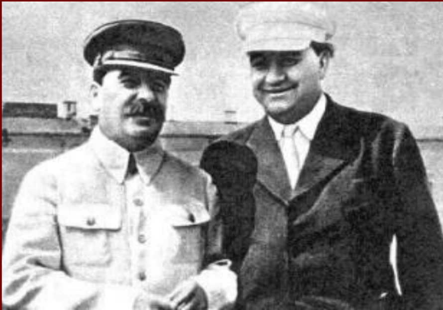
И.Сталин и Г.Димитров, глава болгарских коммунистов

С 1947 г. под давлением СССР ускорился процесс формирования коммунистических правительств в странах «народной демократии». В это же время установился коммунистический режим в Северной Корее, а в 1949 г. – в Китае. СССР оказывал им огромную материальную помощь, «привязывая» к себе. В 1949 г. был создан Совет экономической взаимопомощи (СЭВ), а в 1955 г. – Организация Варшавского Договора (ОВД). Кроме того, коммунисты оказались у власти во Франции и в Италии.