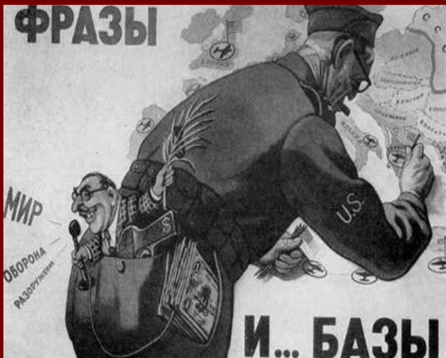
В.Говорков Фразы и базы.

Уже 11 мая 1945 г. США объявили о прекращении поставок в СССР по ленд-лизу. Применяв атомную бомбу, США стали отходить от достигнутых в годы войны договоренностей. США решили не делить Японию на зоны оккупации.