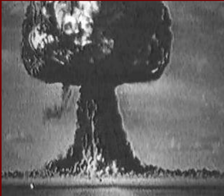
Испытание советской атомной бомбы.

После войны в СССР по-прежнему огромное значение придавалось развитию фундаментальной науки, что объяснялось ее нацеленностью на военную сферу. Были открыты филиалы АН СССР в Дагестане, Карелии, Якутии. Общее число научных работников за 10 лет удвоилось. В 1949 г. под руководством академика И. Курчатова был успешно реализован советский атомный проект и взорвана 1-я советская атомная бомба. В 1953 г. под руководством А. Сахарова, И. Тамма, Ю. Харитона, Я. Зельдовича была создана водородная бомба.