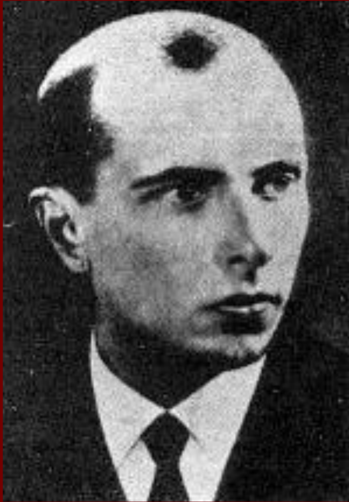
С.Бандера-лидер Украинских националистов.

Вместе с тем коллективизация, репрессии и прочее на территориях, присоединенных перед войной к СССР (Украина, Литва, Латвия, Эстония), вызвали мощные национальные движения. НКВД проводило массовые операции в этих районах и к 1951 г. сопротивление практически было сломлено. Параллельно проводились депортации членов семей.