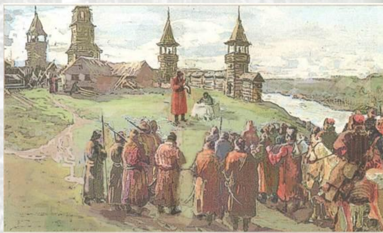
Рис. 50. Строительство г. Тамбова, 1636 г. Реконструкция

На лесистых берегах Цны, появились служилые люди в том месте, где сливается с ней речка Студенец. По указу царя Михаила Федоровича велено было ставить здесь крепость.