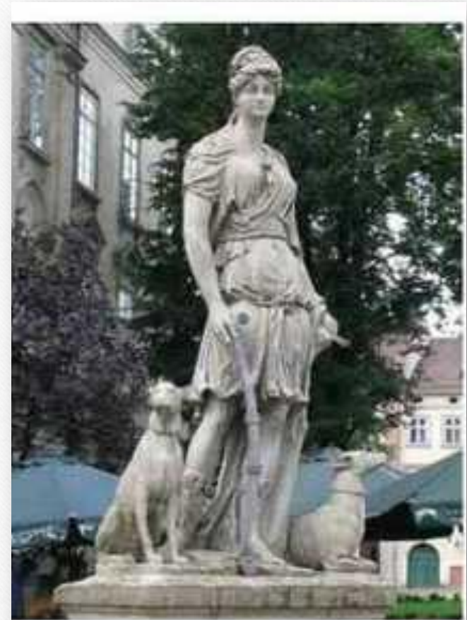
Фонтан Діана на площі Ринок, м. Львів, Україна

Поширеними видами скульптури були статуї, рельєфи, скульптурні портрети та публічні пам'ятники, які давали митцям можливість ідеалізувати військову доблесть і мудрість державних діячів.