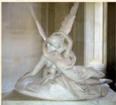
А. Канова "Поцілунок Амура та Психеї"