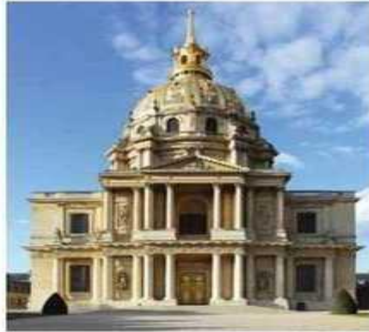
Собор Будинку Інвалідів, м. Париж, Франція