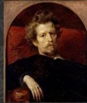
Брюллов Карл Павлович