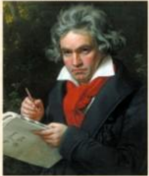
Людвіг ван Бетховен за написанням чергового твору