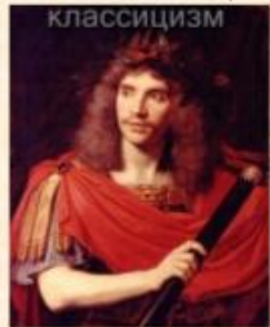
Жан Батист Мольєр