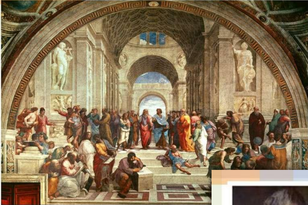
Афінська школа, Рафаель, 1511