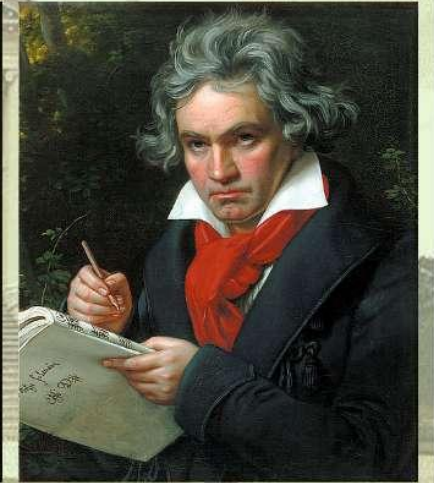
Моцарт. Маленька нічна серенада (Серенада № 13 соль-мажор) (1787)