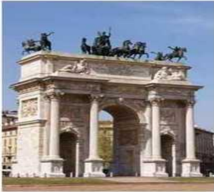
Арка Миру, м. Мілан, Італія