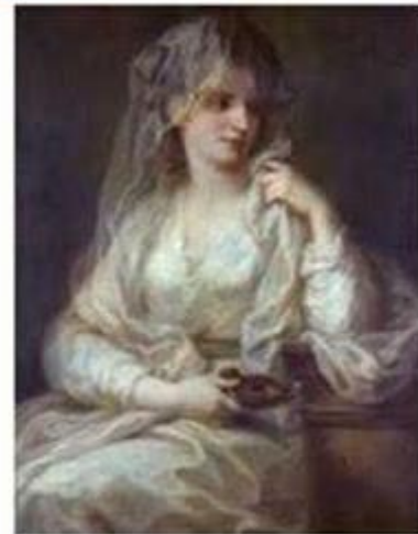
А. Кауфман. «Жіночий портрет у вигляді весталки»

Брюллов відвідав Помпеї в 1828 році і зробив багато начерків для майбутньої картини про відоме виверження вулкана Везувій у 79 році до н. е. та руїни Помпеїв біля Неаполя.