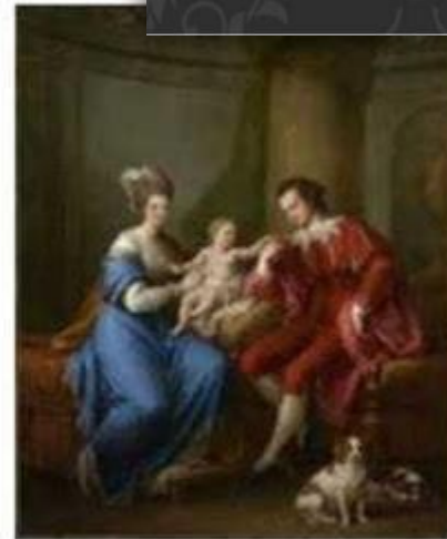
А. Кауфман. «Портрет графині Сміта-Стенді, графа Дербі, з жінкою та синами»