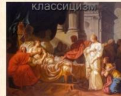
Жак Луї Давид «Антиох і Стратоніка»