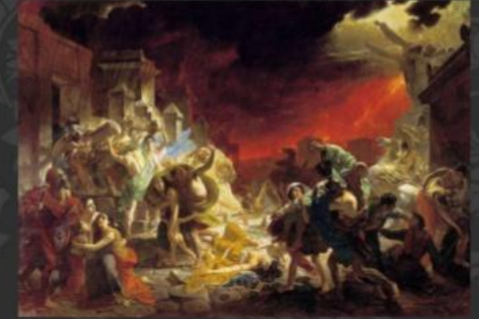
Картина «Останній день Помпеї»

Брюллов відвідав Помпеї в 1828 році і зробив багато начерків для майбутньої картини про відоме виверження вулкана Везувій у 79 році до н. е. та руїни Помпеїв біля Неаполя.