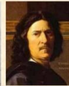
Карл Брюллов і Нікола Пуссен