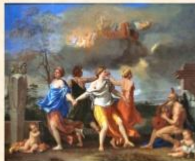
Нікола Пуссен "Танок під музику часу"