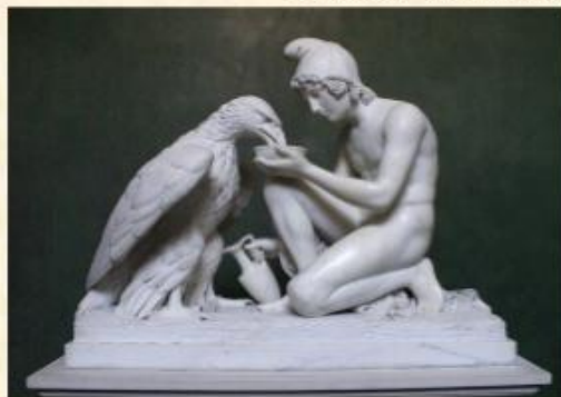
Б. Торвальдсен "Ганімед годує орла Зевса"