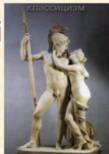
А. Канова "Марс і Венера"