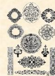
Елементи бароко у архітектурі класицизму