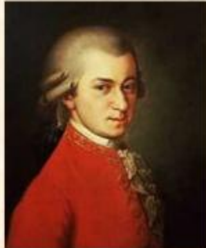
Вольфганг Амадей Моцарт