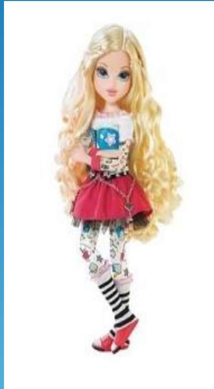
эта кукла красивее