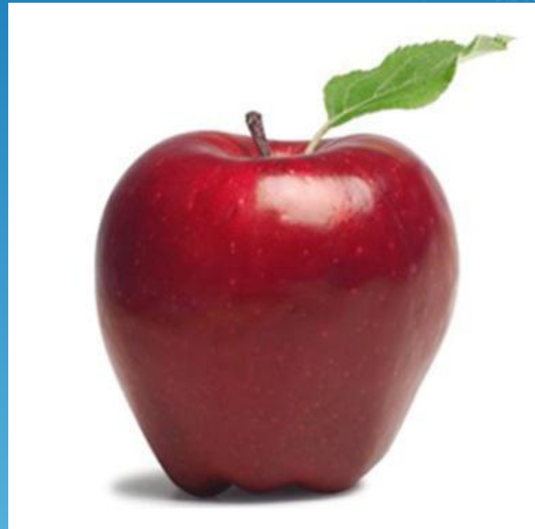
яблоко более красное