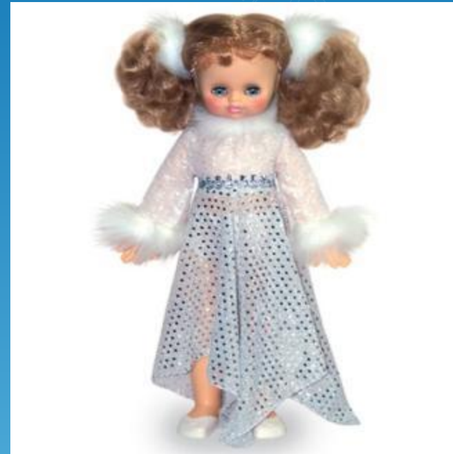
эта кукла красивейшая