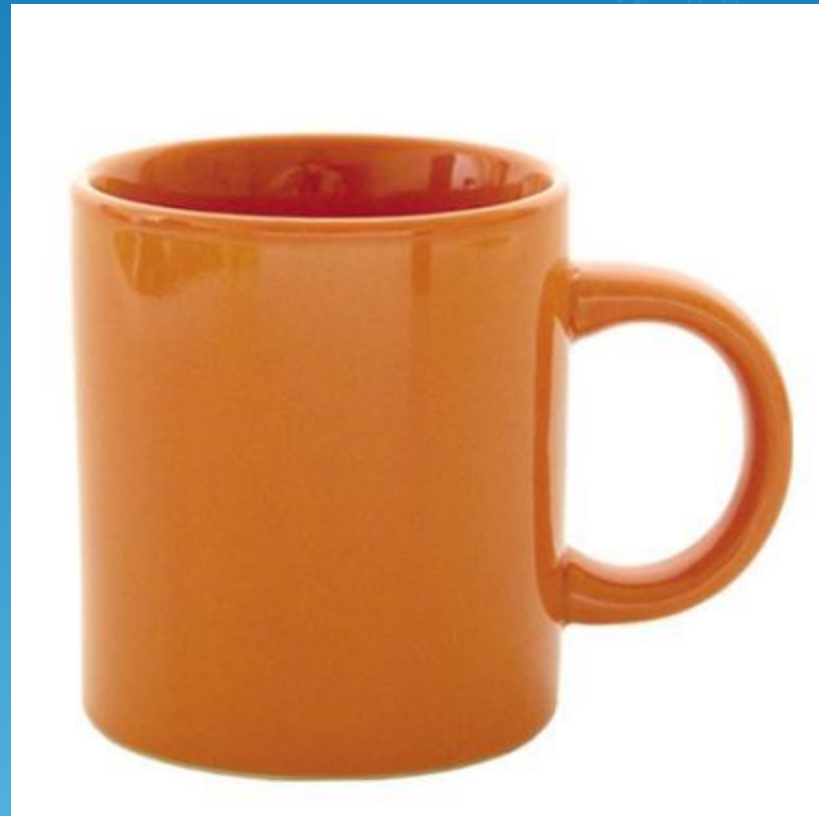
очень большая кружка