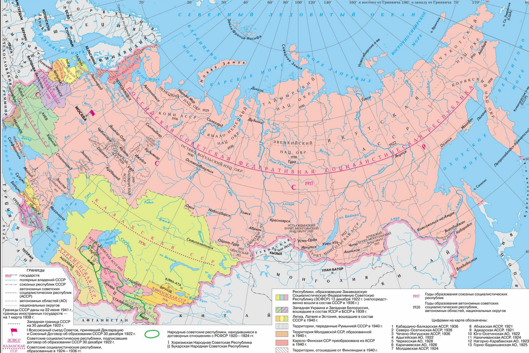
СССР в 1920-1930-е годы. Карта.

ГРАНИЦЫ — государств - - - - - полярных владений СССР - · - · - · - союзных республик СССР - · - · - · - автономных советских социалистических республик (АССР) - · - · - · - автономных областей (АО) национальных округов Границы СССР даны на 22 июня 1941 г., границы иностранных государств — на 1 марта 1938 г. — Западная граница СССР на 30 декабря 1922 г. I Всесоюзный съезд Советов, принявший Декларацию и Союзный Договор об образовании СССР 30 декабря 1922 г. Советские социалистические республики, подписавшие договор об образовании СССР 30 декабря 1922 г. Советские социалистические республики, образованные в 1924—1936 гг. ЗСФСР КАЗАХСКАЯ ССР