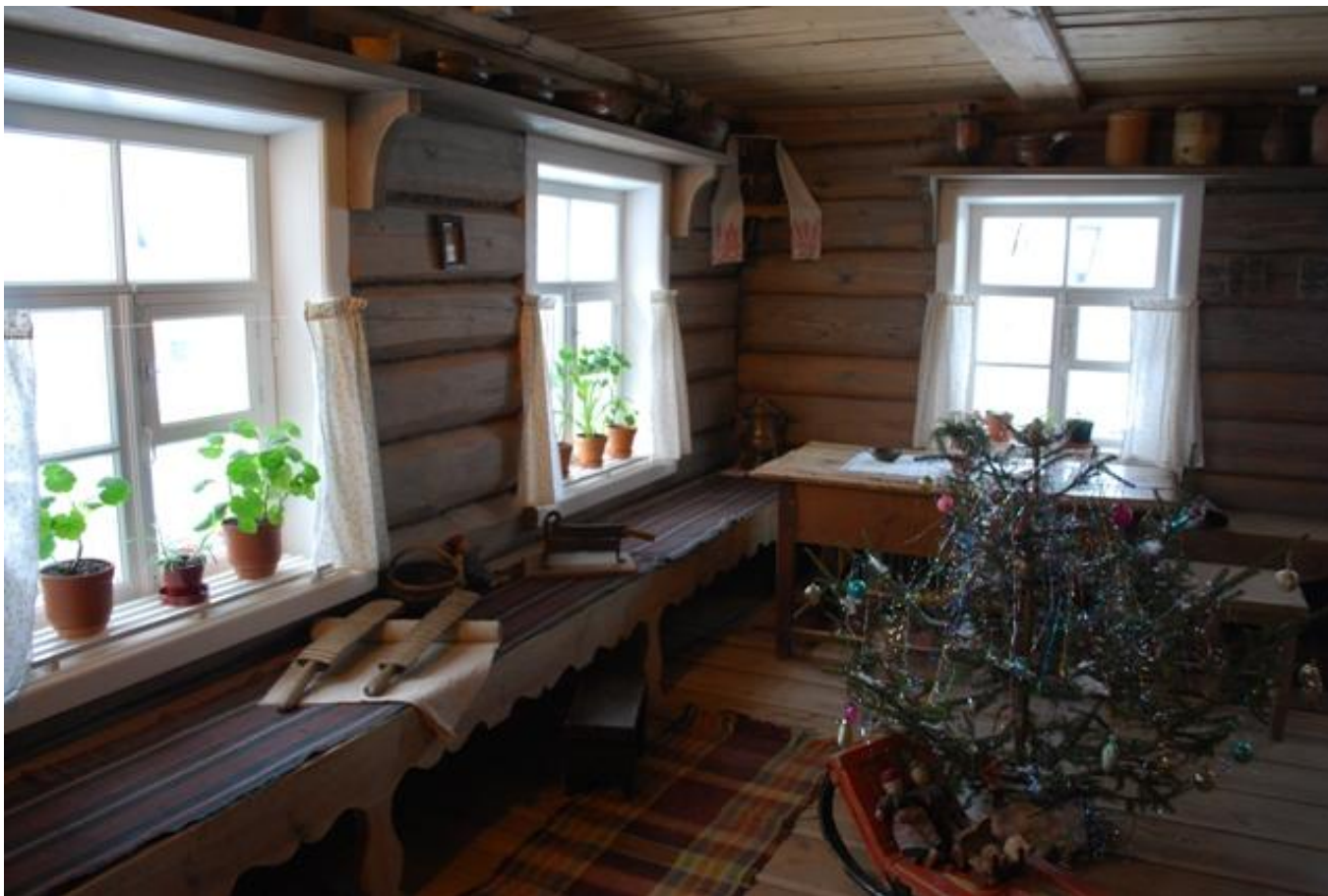
Внутреннее убранство няниного домика