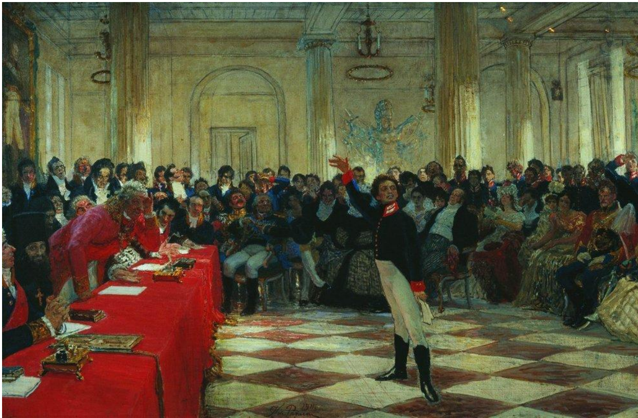
А.С.Пушкин на выпускном экзамене

После окончания лицея, Пушкин поступает на государственную службу в Санкт-Петербурге.