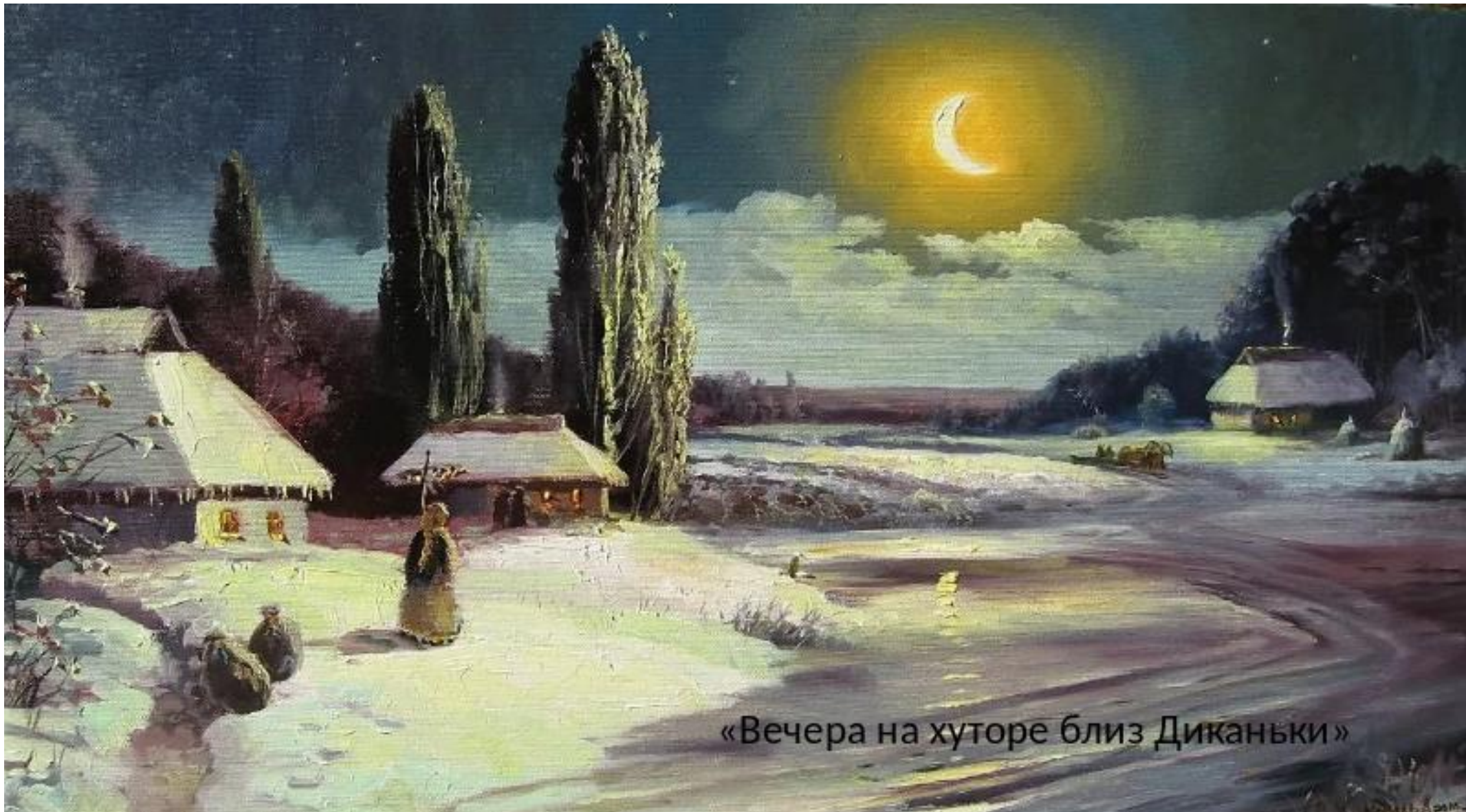
«Вечера на хуторе близ Диканьки»