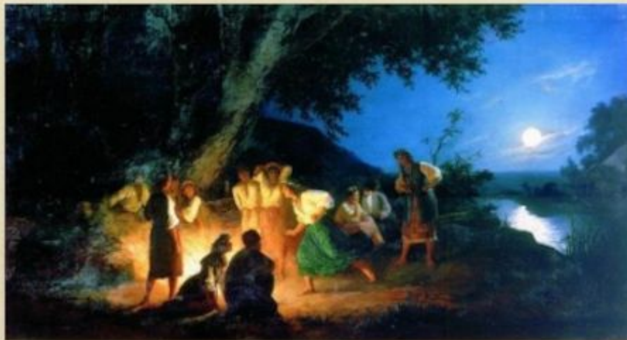
«Басаврюк, или Вечер накануне Ивана Купала» (1830 г.)