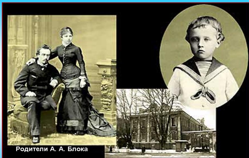
Родители А. А. Блока