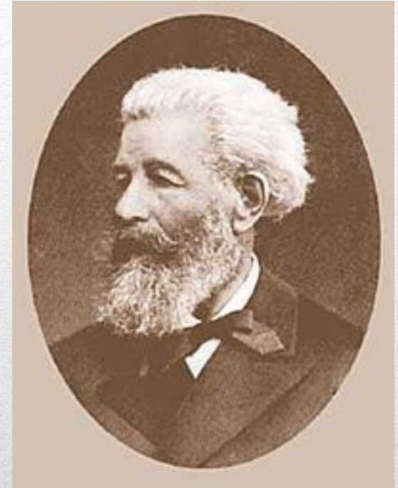
Андрей Николаевич Бекетов