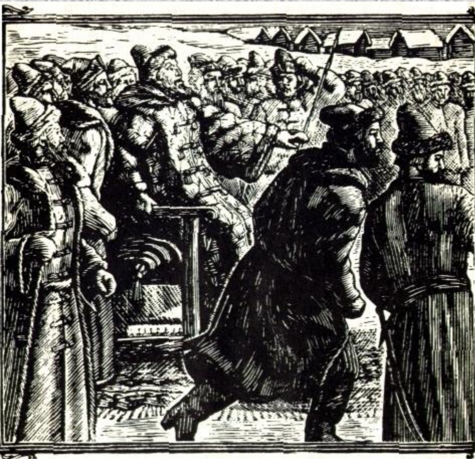
Рисунок В. Фаворского