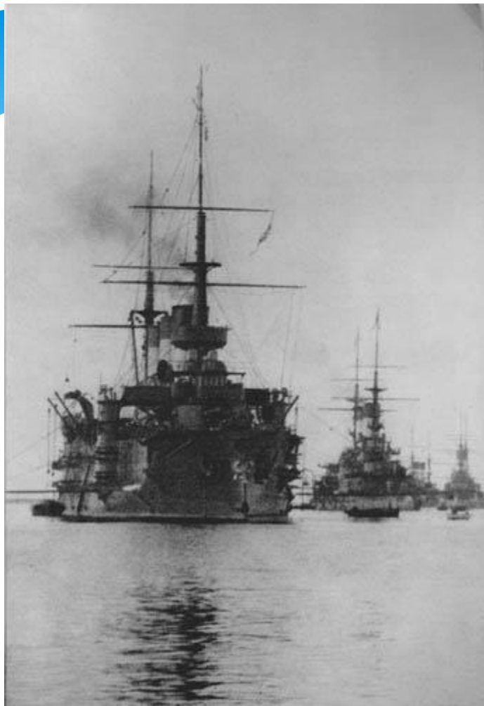
2-я Тихоокеанская эскадра