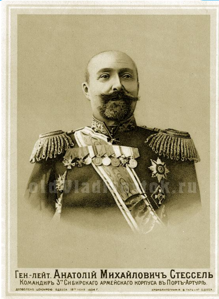
Ген.-лейт. Анатолий Михайлович Стессель Командир 3 го Сибирского армейского корпуса в Порт-Артурь.

(1848 – 1915), российский военачальник, генерал-лейтенант (1901). Участник подавления Ихэтуаньского восстания. В русско-японскую войну начальник Квантунского укрепленного района, проявил бездарность и трусость, сдал Порт-Артур противнику. Приговорен военным судом к смертной казни, но помилован царем.