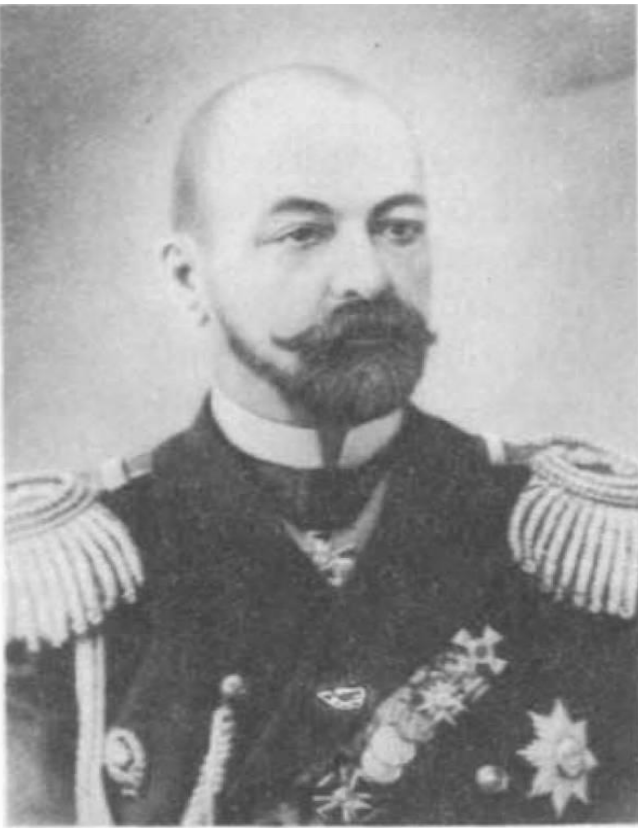
Контр-адмирал З. П. Рожественский

(1848 – 1909), российский вице-адмирал (1904). В русско-японскую войну командовал 2-й Тихоокеанской эскадрой, совершившей переход из Балтийского м. на Дальний Восток и разгромленной в Цусимском сражении (1905).